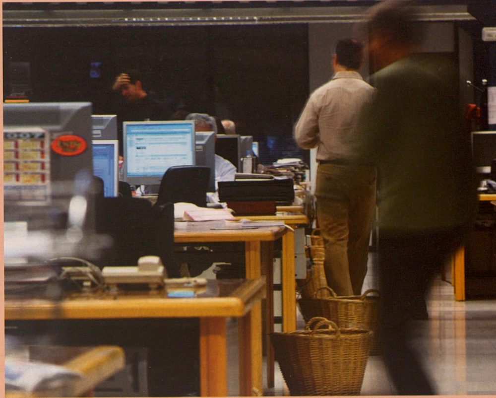
La professió periodística cada cop es considera més d'esquerres, segons l'estudi.

dos extrems, trobem un 13,3% que percep ingressos per sota de 1.000 euros o exactament en aquesta xifra, i un 13,7% en l'altre extrem, que declara cobrar més de 3.000 euros mensuals. Del segment que menys ingressos obté, val a dir que un 3,7% declara no tenir ingressos, un 2,8% en té, però no arriba a 500 euros al mes, i un 6,8% ingressa