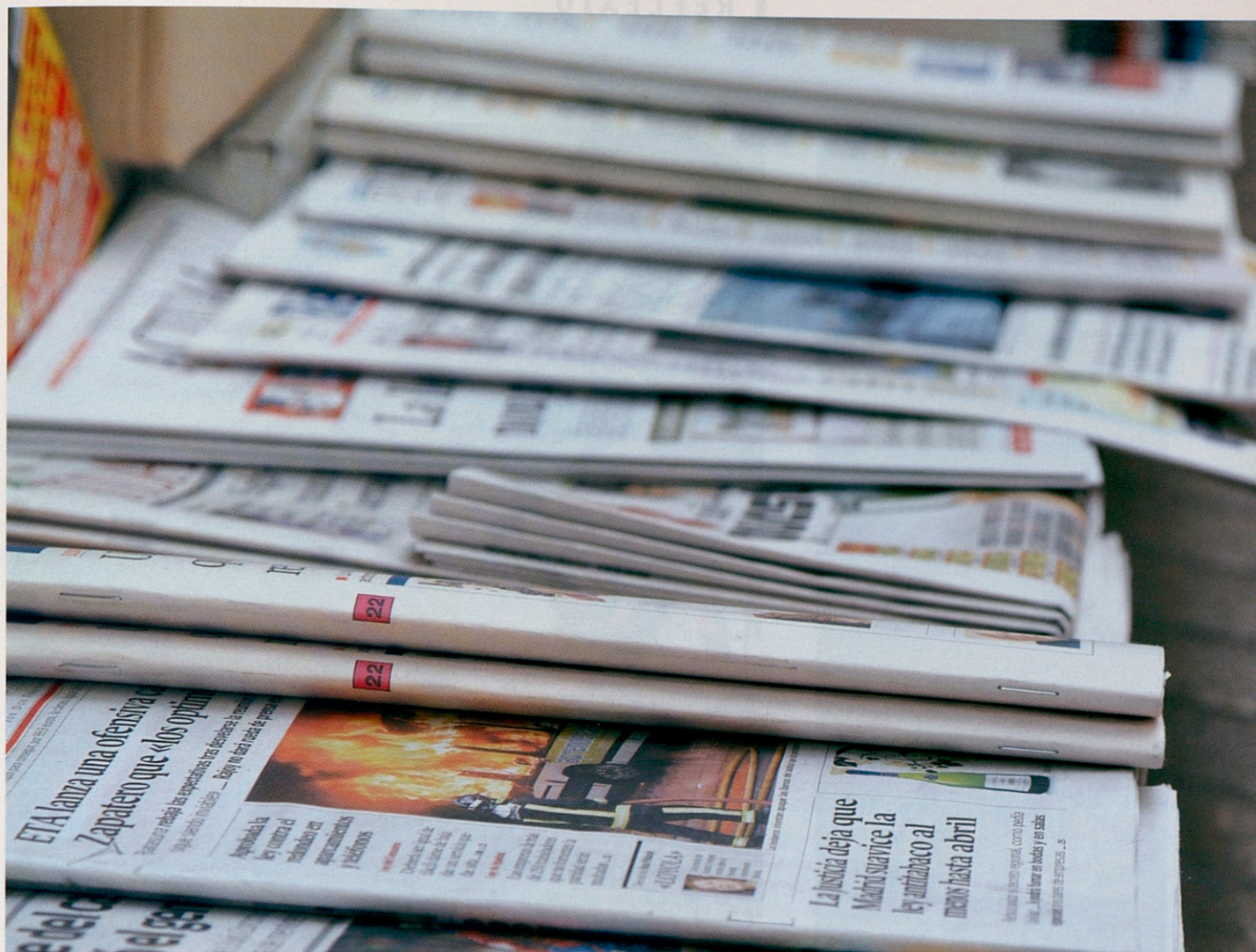
Un equip d'investigadors de la UAB ha analitzat les notícies que surten a la premsa escrita.

que condicionen el que considerem notícia, i a qui valorem com a protagonista actiu o passiu.