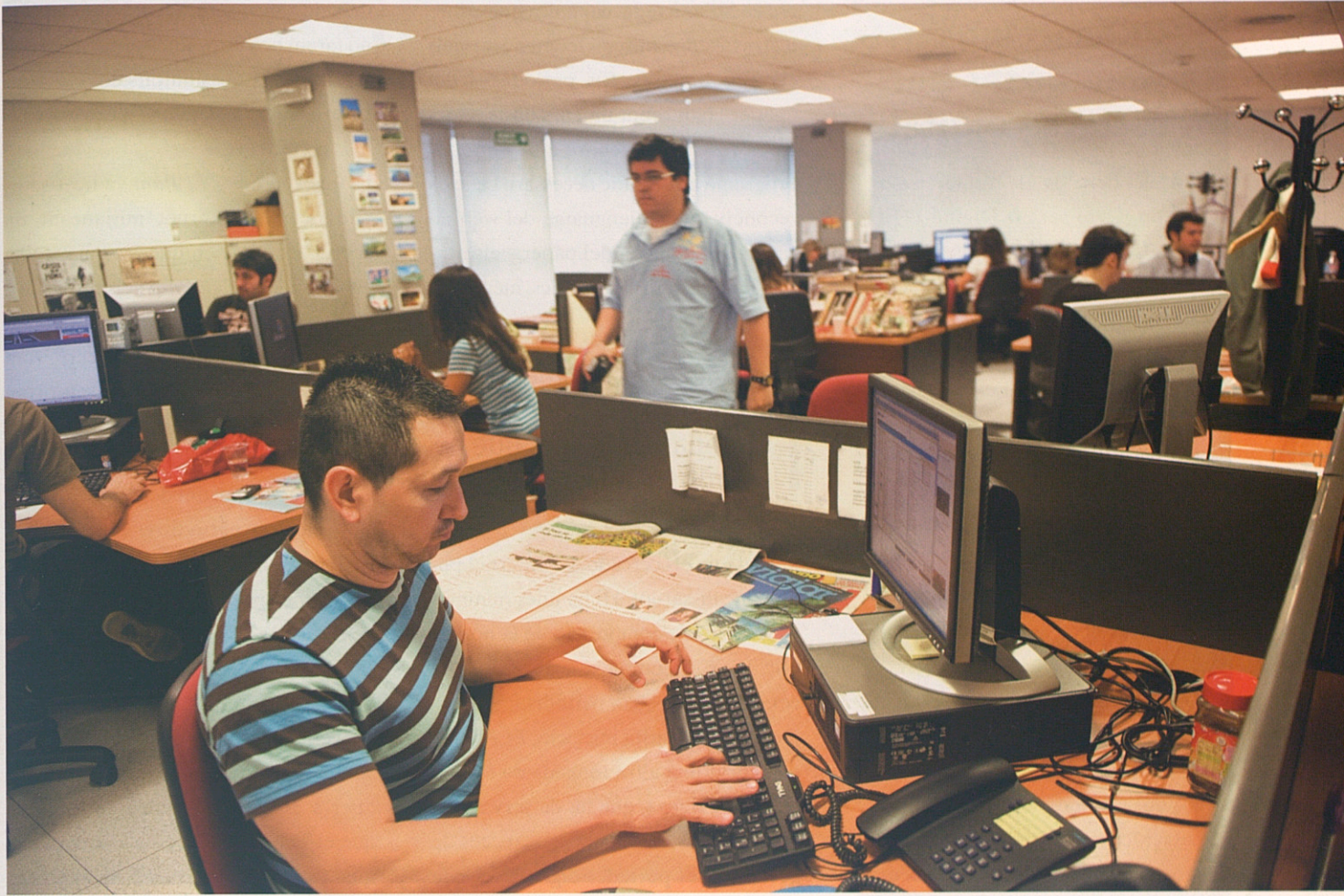
Redacció de Lavanguardia.es; que en els darrers tres anys ha triplicat el nombre de periodistes en línia.

dia, l'enllaç entre notícies, la cobertura més gràfica..." En aquest sentit, la versió digital disposa de vint-i-set periodistes en línia (el triple que l'any 2006, quan Sierra va arribar al diari) repartits en quatre grans àrees: producció pròpia, actualització, serveis i participació de la comunitat de lectors. Entre altres coses, aquestes persones són responsables de l'elaborada hemeroteca digital del diari o de la creació de vídeos de producció pròpia que es van penjant al web.