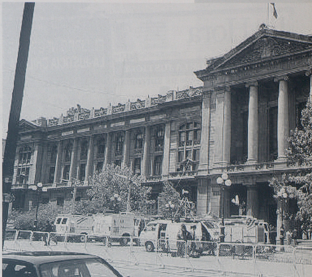
Unitats mòbils de televisió davant la seu de la Cort Suprema de Xile.

Les pràctiques periodístiques a Xile estan marcades per la uniformitat. Tant a la premsa escrita com a la televisió es repeteixen els mateixos enfocaments, les mateixes declaracions, els mateixos protagonistes. Als fronts de la notícia els periodistes no competeixen entre si per oferir elements diferenciadors als seus lectors o televidents. L'intercanvi d'informacions, fins i tot de