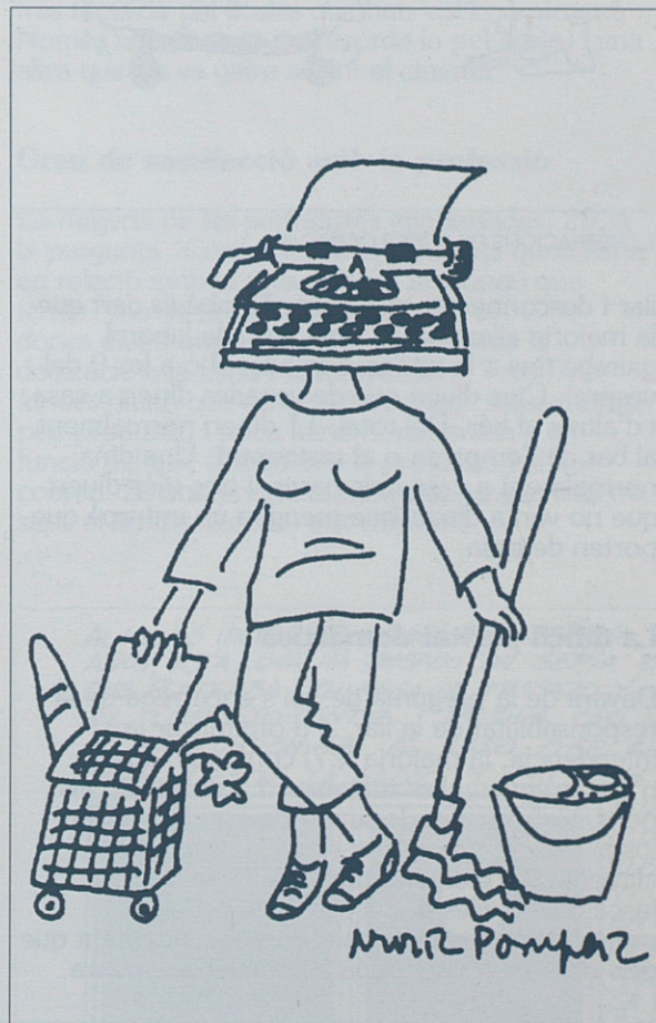
IL·LUSTRACIONS DE NÚRIA POMPEIA

Deu de les dones periodistes enquestades viuen en parella amb fills/es, sis en parella sense fills, cinc viuen soles, unes altres cinc viuen només amb els seus fills/es, dues viuen amb els seus pares i dues més amb amigues en un pis compartit.