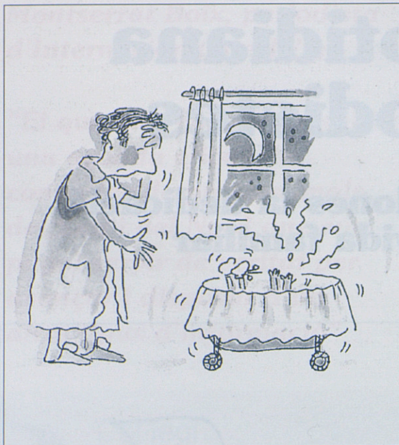
IL·LUSTRACIONS DE ROSER CAPDEVILA

Tres de les enquestades prefereixen quedar a l'anonimat. •