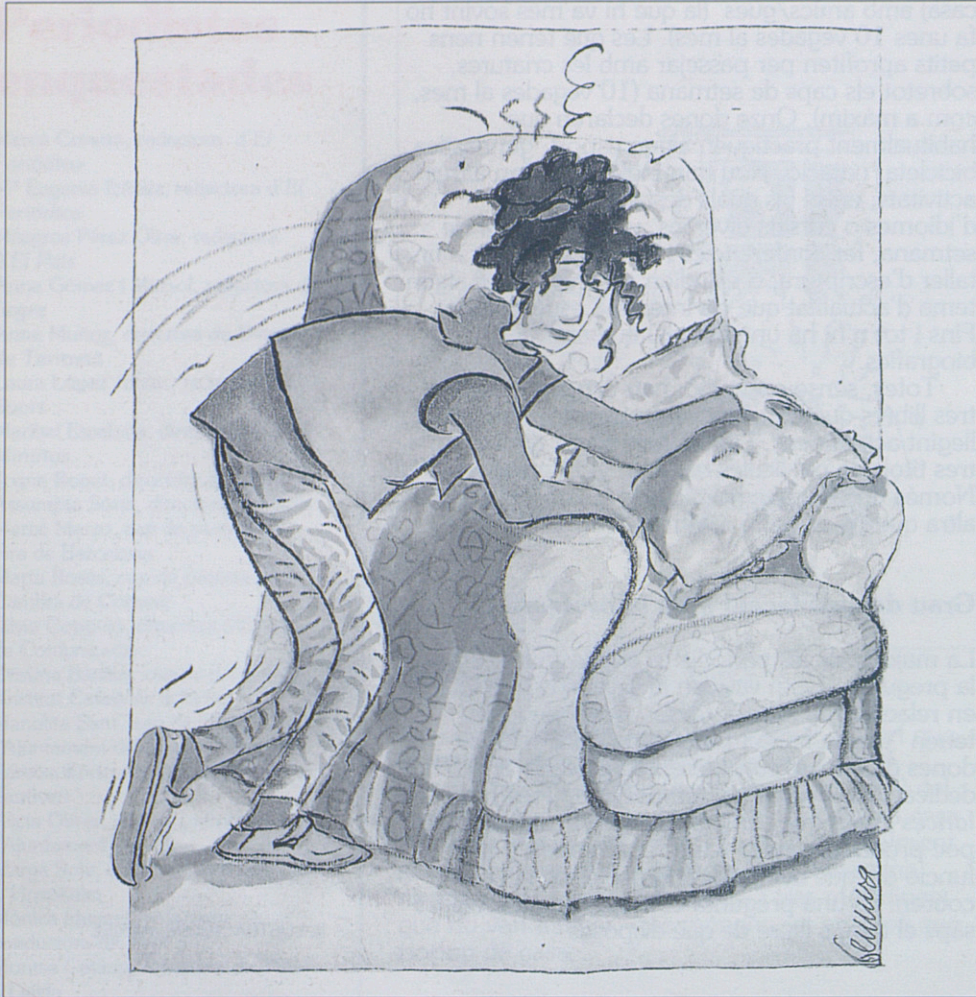
IL·LUSTRACIÓ DE GEMMA SALES

Tampoc és fàcil per a les dones periodistes desconnectar dels temes laborals. Les postures majoritàries van des de "Intento desconnectar, encara que no puc" (16), fins a "Els temes de la feina formen part de la meua vida quotidiana i mai no puc oblidar-me'n" (9). Quatre dones afirmen que sí que poden desconnectar i oblidar-se totalment de la feina, i una més diu que depèn dels temes.