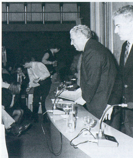
Alfa i Omega del Màster: a dalt, la conferència de premsa amb què es va presentar el mestratge, el 6 de setembre de 1989. A l'esquerra, l'acte de cloenda, el 23 de març de 1993.

— Professors universitaris han impartit les classes junt amb professionals del periodisme —