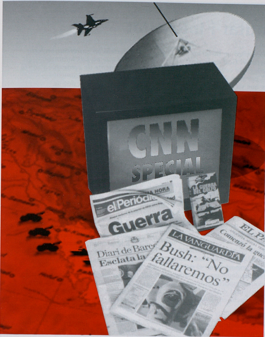
IL·LUSTRACIONS: JORDI PERNAU

Cap dels enviats espanyols no va poder-se integrar en el pool autoritzat per estar present al front