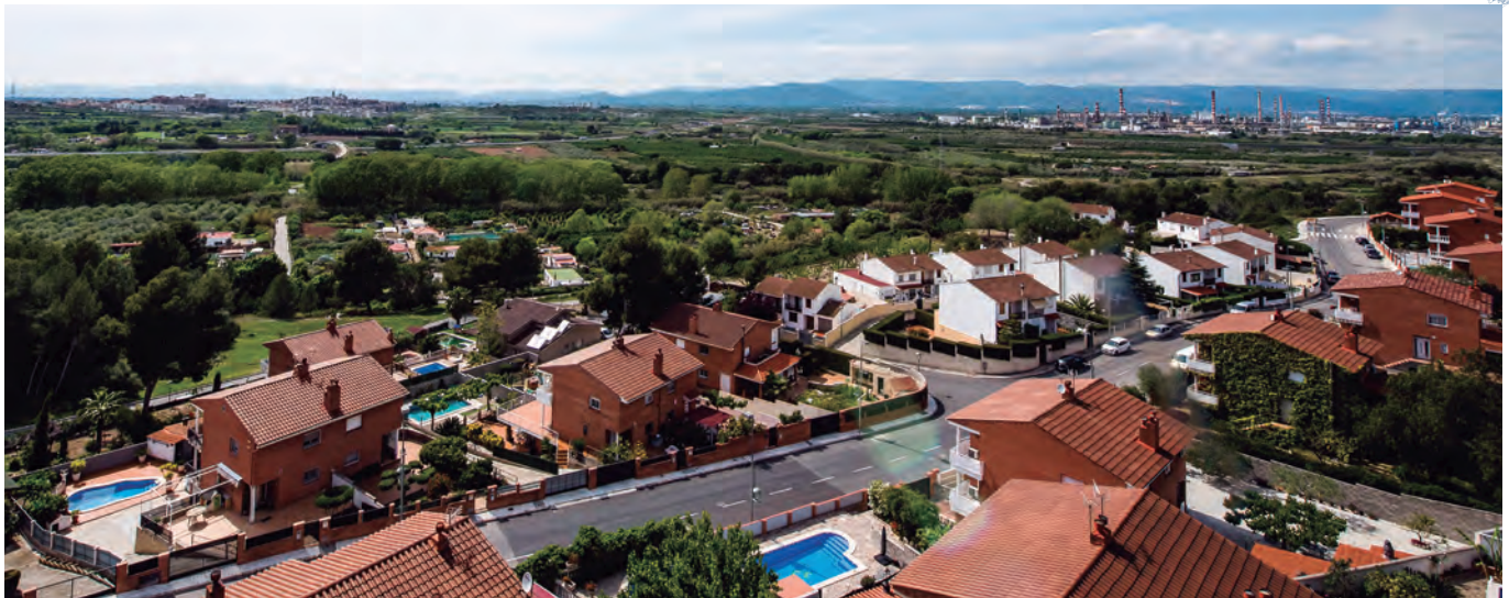
Un espai històric i natural, la conca del riu Francolí, ocupat per àrees residencials i industrials. Vista des del Barri de Sant Salvador (Tarragona), al fons Repsol i el Complex Petroquímic Nord (als termes de la Pobla i el Morell) i, a l'esquerra, el poble de Constantí