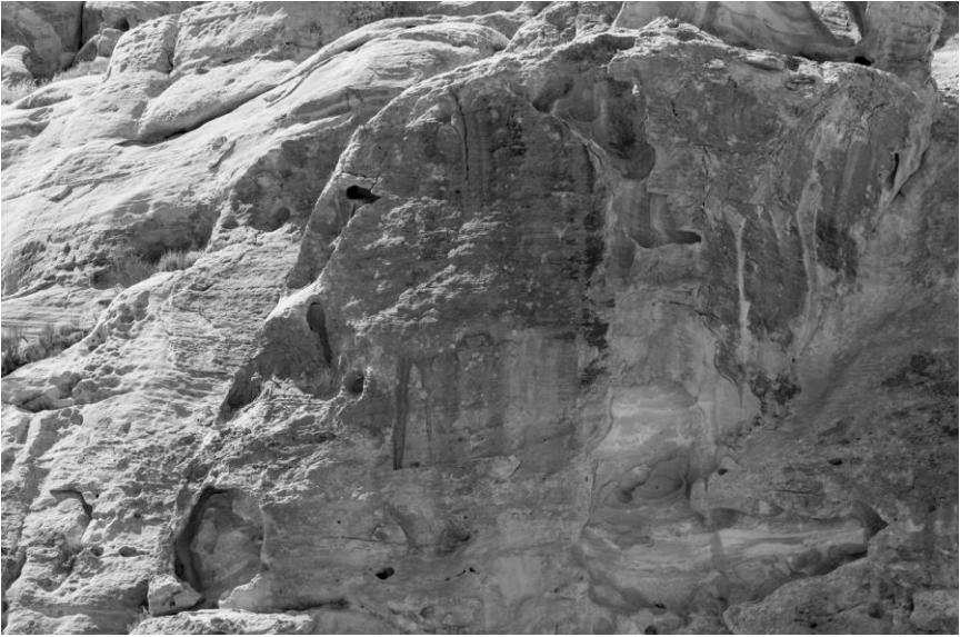
Fig. 3 Relieve de Nabónido