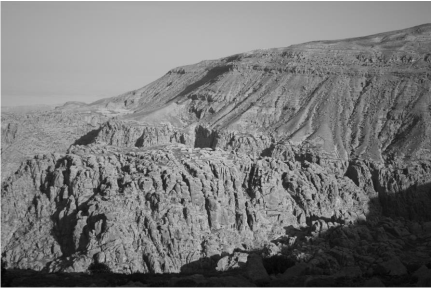
Fig. 1 Vista de Sela desde el pueblo moderno homónimo