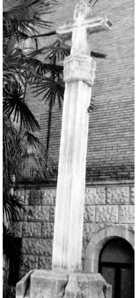
Dues vistes de la creu en la seva actual ubicació, any 2013.

sanejar tota la creu i es va impermeabilitzar amb líquid hidrofugant perquè no l'afectés la humitat; posteriorment van rascar fins trobar la pedra viva. 28 La creu va canviar de lloc, aquest cop al darrere del campanar de la mateixa església de Sant Jaume de Mollerussa, on resta actualment.