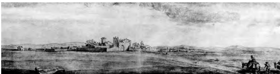
Mollerussa el 1668, segons una aquarel·la de Pier Maria Baldi. A la part dreta del lector hom pot observar una creu.

c) Sempre ha estat a la seva mateixa ubicació. Al meu llibre Personatges i història de Mollerussa dic: “ aquesta creu era al mateix lloc on es troba ubicada ara, és a dir, als afores de la vila quan el nucli habitat encara no s'havia expandit. Aquest anà creixent i la creu quedà dins el seu perímetre, al carrer on es troba actualment .” 42