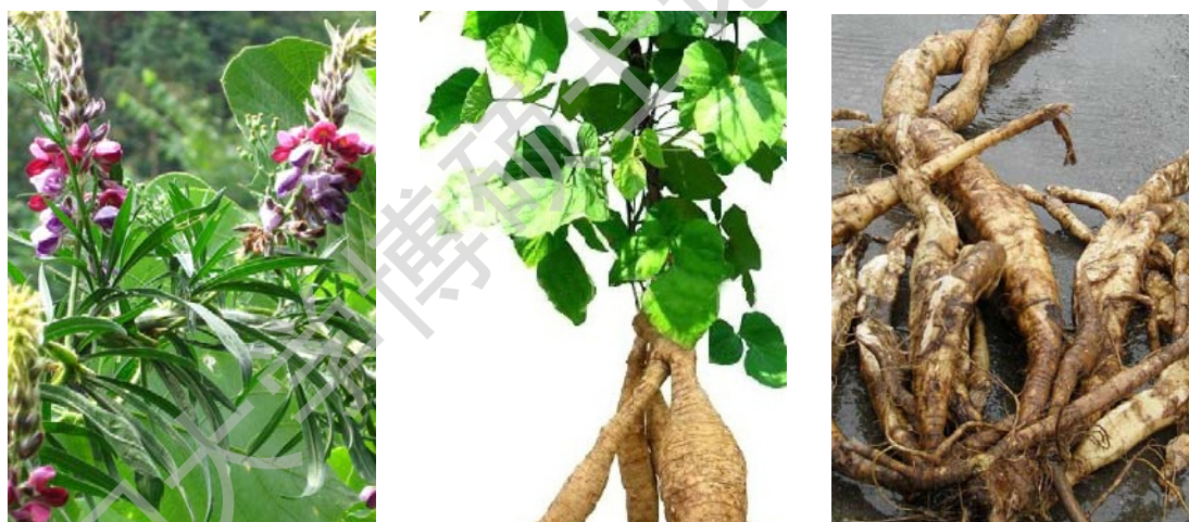
图 1 野葛的植株形态及其药材

2005 年版的《中华人民共和国药典》中指出，葛根为蔷薇目豆科葛属植物野葛 Pueraria lobata (Willd) Ohwi（如图 1 所示）或甘葛藤（习称粉葛） Pueraria thomsonii Benth 的干燥根 [1] 。葛根是我国传统沿用的中药，用葛根治疗一般疾病和疑难杂病在我国古代的医学著作《神农本草经》、《本草纲目》、《伤寒杂病》和《医学大辞典》中早有记载。日本的《日养食》和《和歌食物本草》也记载它是有“甘淡、无毒、除热、止渴、通便、解酒、养胃”之功效。现代药理研究证明，葛根具有解肌退热、生津、透疹、升阳止泻的功效，多用于治疗外感发热、头痛、项强、消渴、麻疹不透、热痢、泄泻、高血压等症 [2] 。