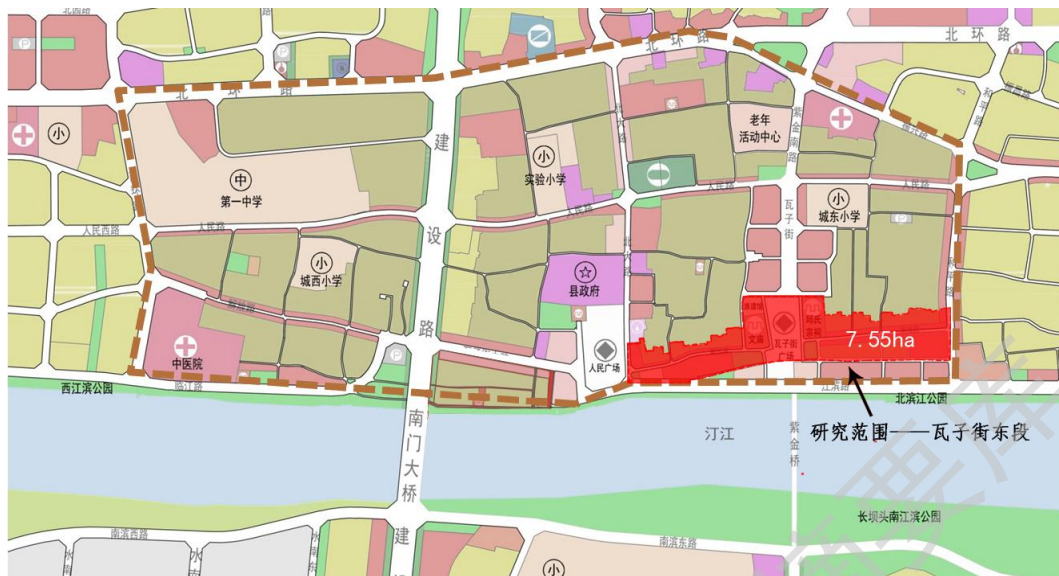
图 1-2 研究范围