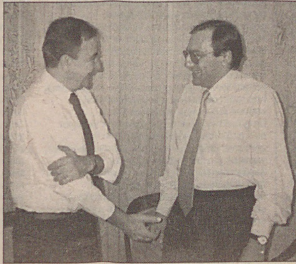
TC'nin ve Ermenistan'ın Suriye Büyükelçileri...