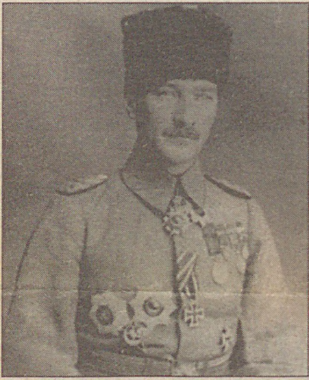
Otel Baron'un arşivindeki Atatürk resmi.