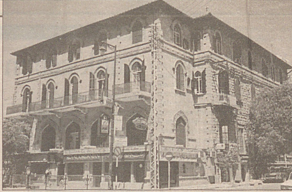
Otel Baron'a daha sonraki yıllarda bir kat ilave edilmiş.

Mustafa Kemal'in altı ay süreyle kaldığı Barons' Otel'deki oda numarası 28. Bugün odanın kapısında 217 rakamı asılı. Haleb'deki otelde bir de onun Ermeni fotoğrafçı Derunyan'a çektiği fotoğraf var.