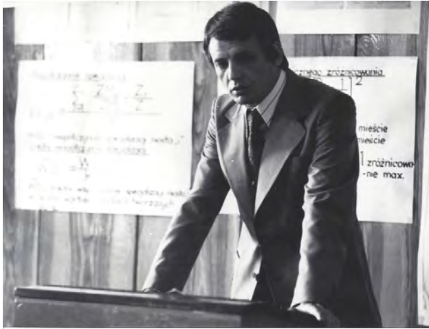
Fot. 1. Prof. Andrzej Suliborski podczas obrony pracy doktorskiej (1976 r.)

Ważnym aspektem działalności naukowej A. Suliborskiego, w zakresie problematyki miejskiej, są różne niepublikowane opracowania eksperckie na potrzeby miast. Były to studia z zakresu problematyki mieszkaniowej, oceny funkcjonowania gospodarek miast, strategie rozwoju miast i inne.