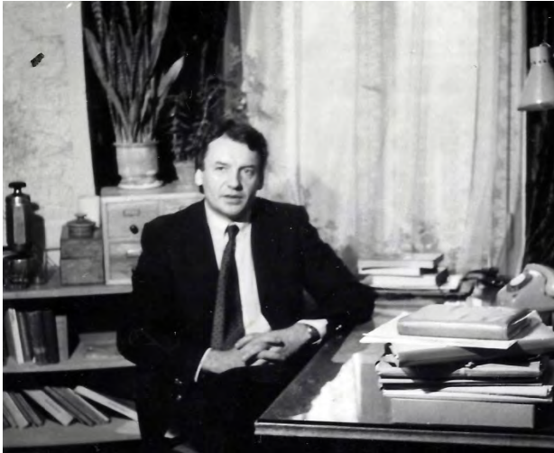
Fot. 2. Prof. Andrzej Suliborski w pracy (1987 r.)

Za największe osiągnięcie naukowe A. Suliborskiego w zakresie studiów regionalnych należy uznać dopracowanie metodologii analizy regionalnej, polegającej na odejściu od ujęcia monograficznego na rzecz badania najważniejszych problemów charakterystycznych dla regionu i ich wyjaśnianiu na podstawie celowo wybranych studiów przypadków.