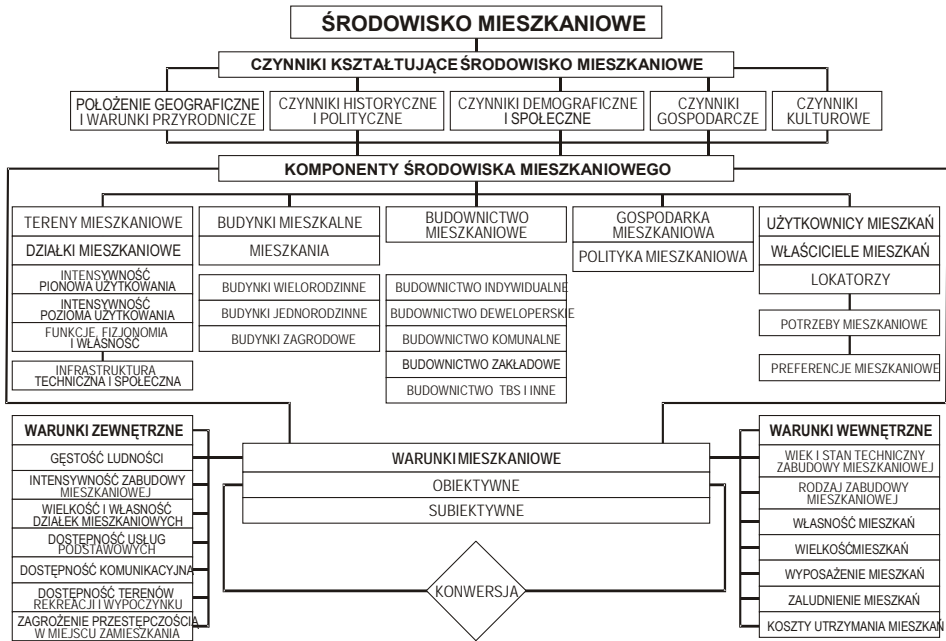
Ryc. 2. Model środowiska mieszkaniowego według J. Dzieciuchowicza (2011)

Potrzeby mieszkaniowe należą do kategorii najważniejszych potrzeb ludzkich. Określa je rozmiar efektywnego popytu na mieszkania (ujęcie liberalne) lub stosunek liczby gospodarstw domowych i mieszkań (ujęcie normatywne) informujący o rozmiarach zaspokojenia lub niezaspokojenia potrzeb mieszkaniowych. Potrzeby mieszkaniowe są zmienne w czasie i przestrzeni, w wysokim stopniu zindywidualizowane i uzależnione od cech demograficznych, społecznych, ekonomicznych i kulturowych.