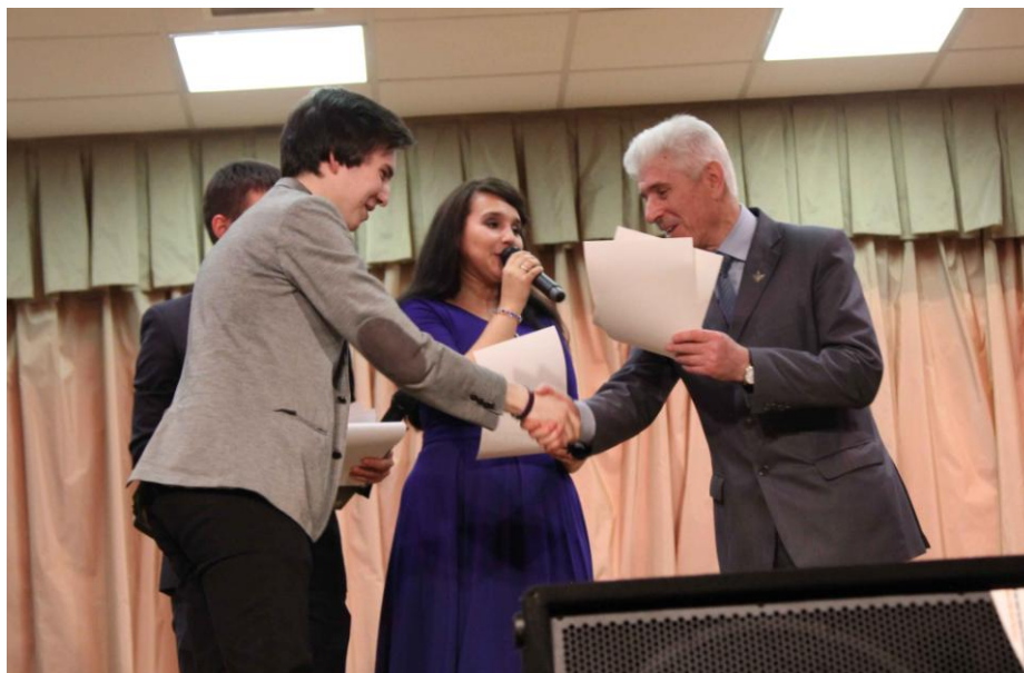
Награждение победителей фестиваля – конкурса