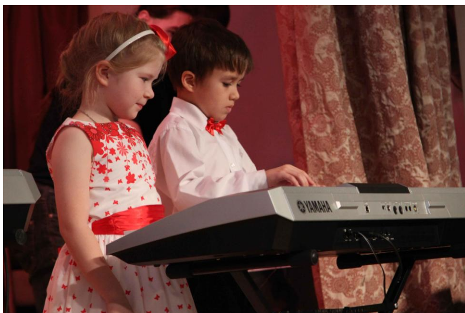
Участники гала – концерта в номинации «Исполнение на ЭМИ»