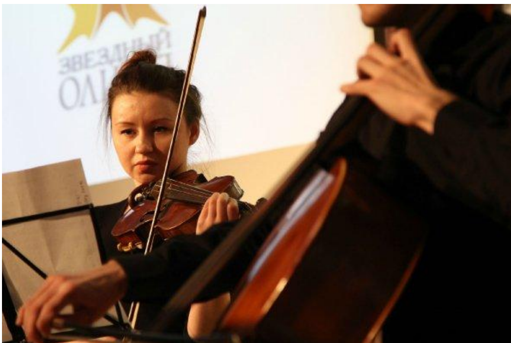
Участники гала – концерта