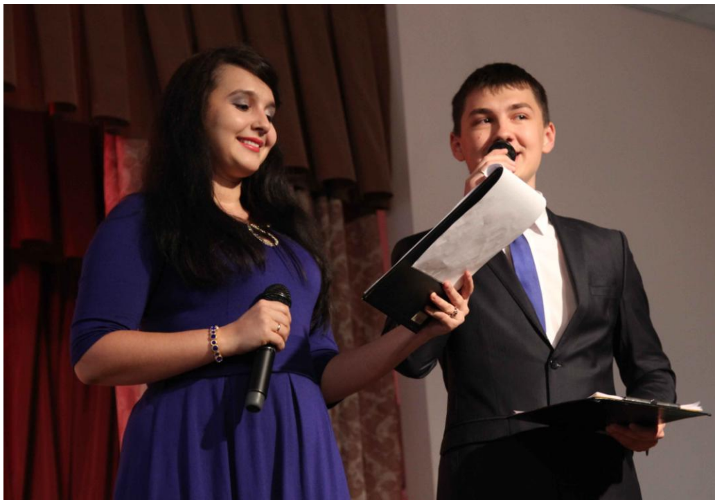
Ведущие гала – концерта