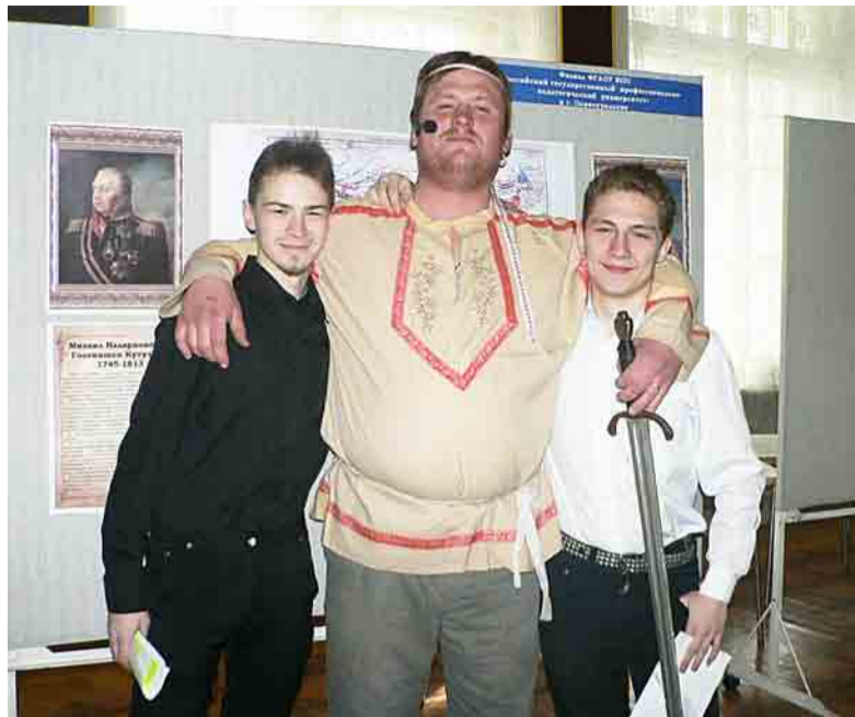
Студенты РГППУ и участник концерта, посвященного 23 февраля, на фоне стендов с исследовательскими проектами

- Весной на базе нашего учебного заведения для школьников и студентов был организован кинолекторий. Тема - семейные ценности. Фильмы представил духовно-просветительский центр храма. Могу сказать, что показанное многих затронуло за «живое». Особенно запомнилось повествование от лица неродившегося ребёнка, о воспитанниках приюта для детей с ограниченными возможностями... После кинолектория провели опрос среди зрителей, который показал, что семья - одна из животрепещущих