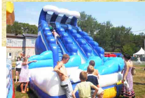
В субботу на стадионе «Хромпик» было жарко - и в прямом, и в переносном смысле: на празднике Уралтрубпрома «зажигали» и взрослые и дети