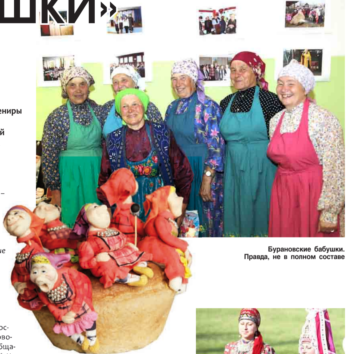
Бурановские бабушки. Правда, не в полном составе