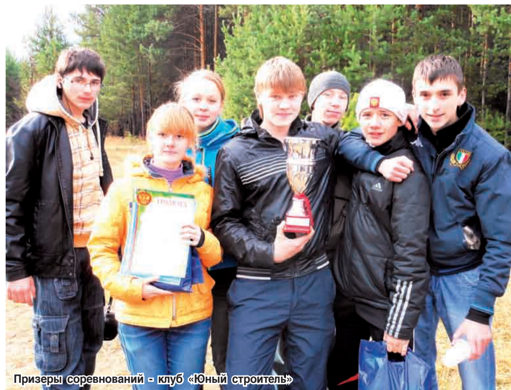
Призеры соревнований - клуб «Юный строитель»

Военно-патриотическая игра клуба «Пограничник» понравилась мальчишкам и девчонкам. Юные бойцы подрывали мины, преодолели пропасть, стреляли в цель – на импровизированном полигоне рядом с лесничеством было жарко!