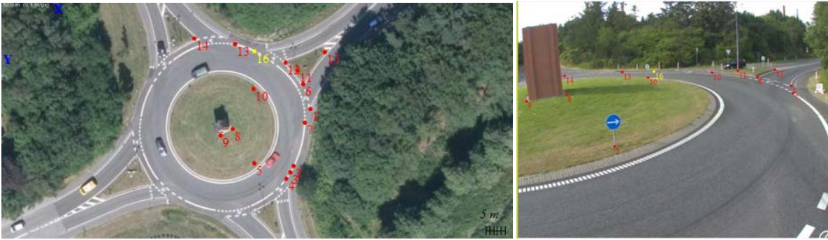
Figur 3. Kalibrering med T-calibration. Til venstre: Ortofoto med punkter. Til højre: De samme punkter i den optagne frame.

For yderligere at sikre kvaliteten af de fundne hastigheder, blev der foretaget et sæt analyser af hastigheden af enkeltkøretøjers passage af rundkørslen med softwaren T-analyst . Princippet er at markere f.eks. bagenden af en bil og gøre dette fra frame til frame for at afklare præcist på, hvilket tidspunkt en givet raster er passeret. Dermed beregnes transporttiden, og rejsehastigheden kan udtrages. På den måde blev de registrerede hastigheder, fundet i RUBA, valideret. Princippet i T-analyst fremgår af figur 4. Med tilstrækkelig registrering af et køretøj, kan hastigheden udtrages.