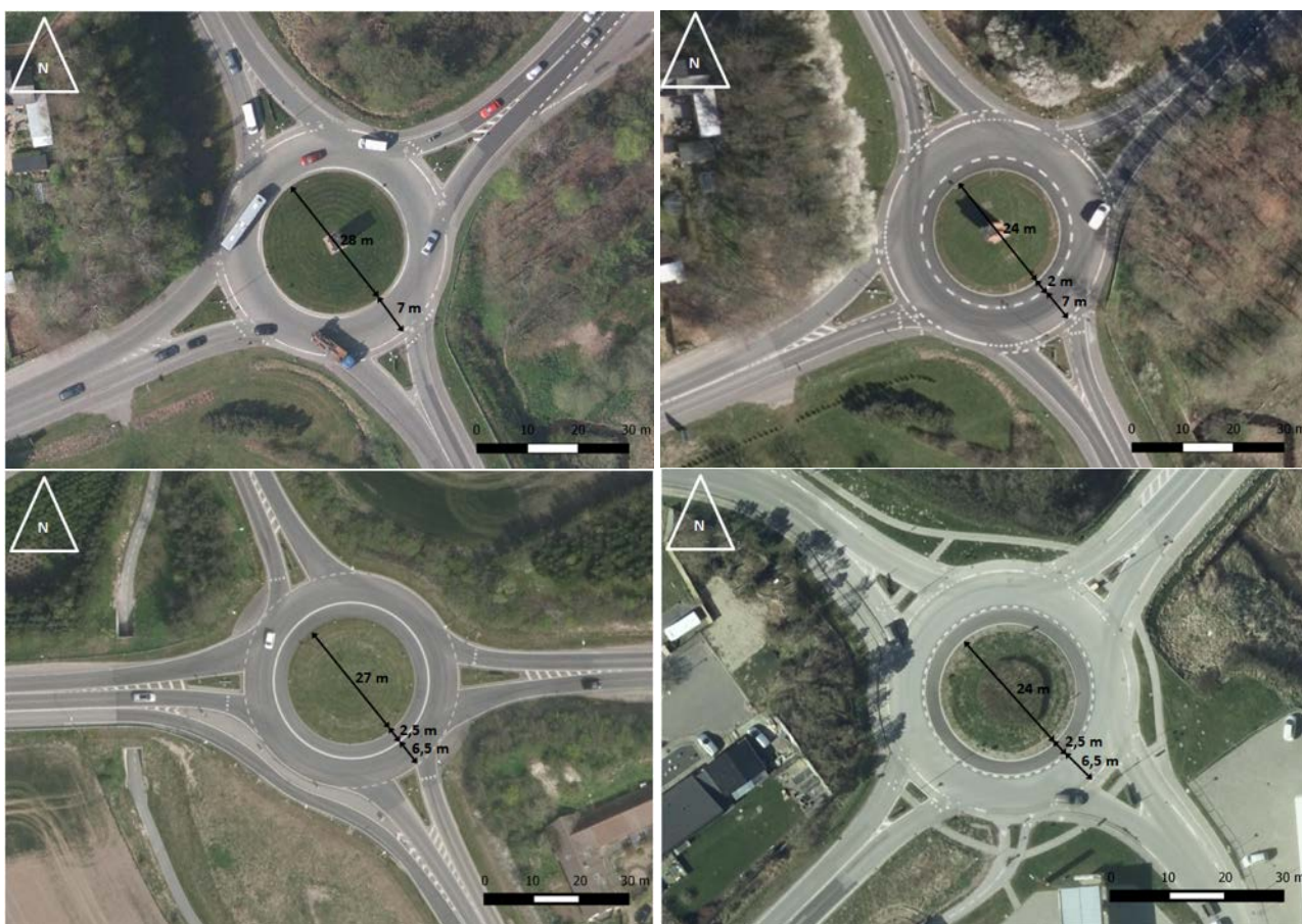
Figur 2. Øverst, til venstre: Rundkørslen før. Øverst, til højre: Rundkørslen efter. Nederst, til venstre: Rundkørslen med. Nederst, til højre: Rundkørslen uden (Kortforsyningen 2016 og egne tilretninger).

et net af tilbagetrukne cykelstier i samme niveau som rundkørslen. Figur 2 og tabel 1 viser rundkørslerne og deres vigtigste karakteristika.