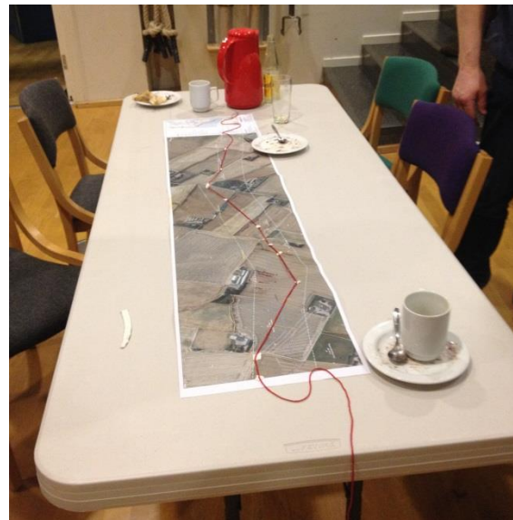
Et eksempel på resultatet af dialogen – en gruppes forslag til kabeltrace