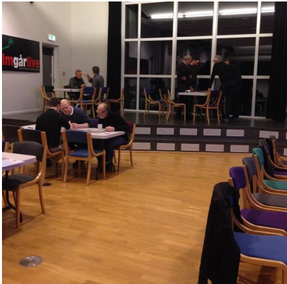
Dialog i nabogrupperne

En forsker fra forskningsgruppen deltog i planlægning og afholdelse af initiativet. Der var således mulighed for at evaluere på forsøget ved at foretage observation under arrangementet samt foretage interview med deltagere og planlæggere både før og efter. Desuden blev lodsejersamtalerne optaget.