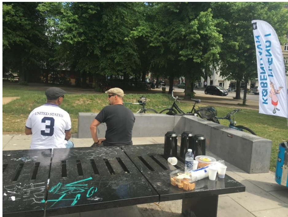
Samtale mellem en peer-ansat og deltagende borger efter 'Spil i parken'.

Disse perspektiver bekræftes desuden af de peer-ansattes oplevelser af deres kontakt med deltagende borgere. Vi kommer derfor i afsnittet med nogle empiriske eksempler både fra deltagende borgere og peer-ansatte.