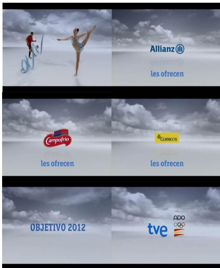
FOTOGRAMAS 22-27: Cortinilla “Objetivo 2012”.

Las cortinillas están muy elaboradas y han creado una relación perfecta en todo momento entre los espacios publicitados y la entidad corporativa de la compañía. Se han dado a conocer con diferentes piezas espacios dirigidos a todos los miembros de la casa y han tenido gran presencia la promoción de espacios culturales.