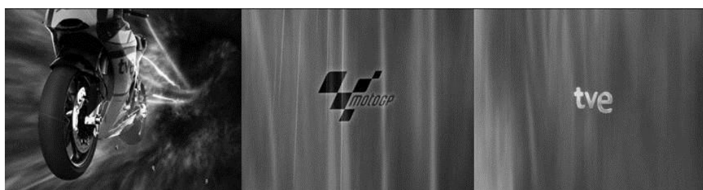
FOTOGRAMAS 19-21: Cortinilla MotoGP.

La pieza autopromocional que se ha podido ver en más ocasiones ha sido la del campeonato de motociclismo (18 ocasiones en el período analizado).