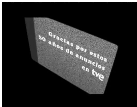
FOTOGRAMA 10: Pack Shot “Gracias”.

Este anuncio fue el último de la cadena, aunque por tratarse de una pieza autopromocional se convierte en una doble marca de un punto y final de una época y de arranque como el primero de la etapa actual donde son este tipo de mensajes publicitarios los que hallamos en las parrillas del ente público.