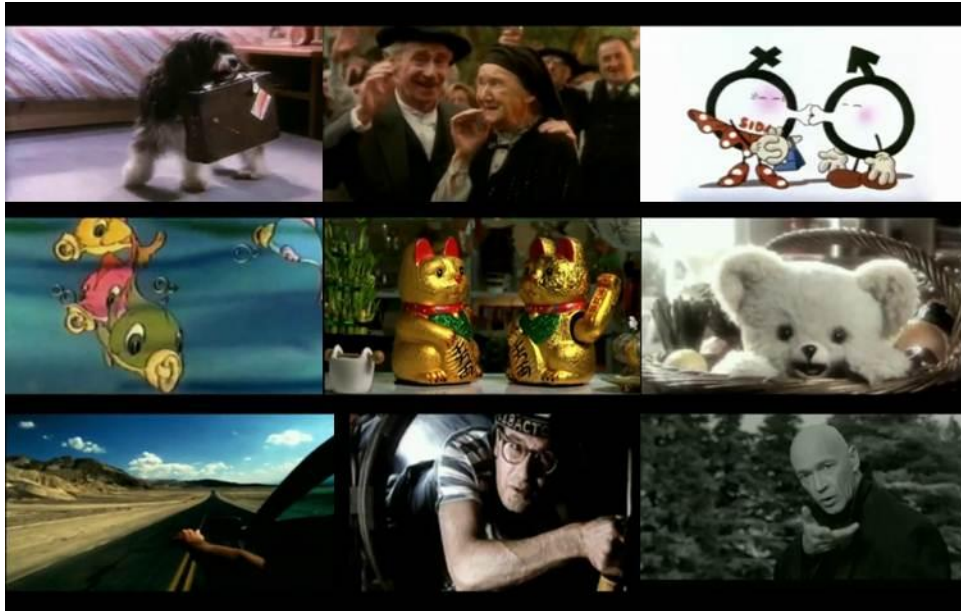
FOTOGRAMAS 1-9: Spot despedida.

De la mano de M&CSaatchi crearon un vídeo homenaje de despedida. En él una sucesión de imágenes, fácilmente reconocibles por el target adulto y perfil del canal, de diferentes spots que han acompañado a TVE durante 50 años, decían adiós a través de una pegadiza música en la que se puede escuchar “goodbye, goodbye”. En el spot personajes tan memorables como el calvo de la lotería, la señora de la fabada, los “pezqueñines”, el osito de Mimosín, entre otros, nos dicen adiós después de haber vivido tantos años juntos. A estos emotivos planos se les suma un mensaje final “La publicidad se va de TVE pero siempre se quedará en nuestro corazón. Gracias por estos 50 años de anuncios en TVE”.