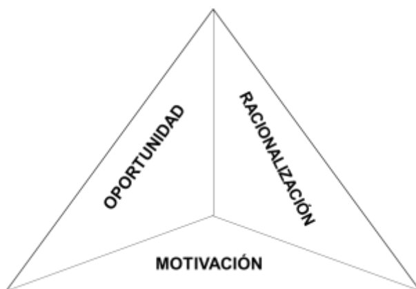
Ilustración 1. El triángulo de riesgos

Fuente: Cressey (1973) citado por Blacker y McConnell (2015).