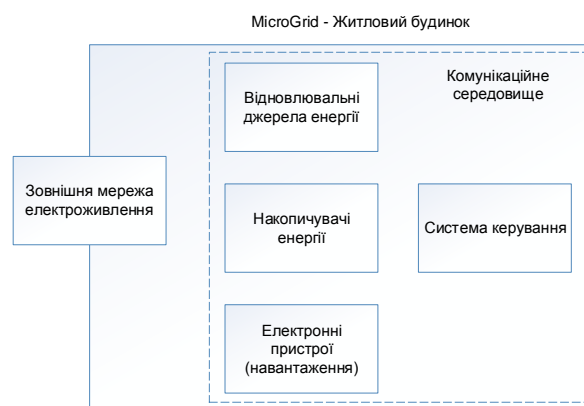
Рис. 1. Житлове приміщення як MicroGrid

Акумуляторні накопичувачі енергії, що підключені до альтернативних джерел енергії та можуть працювати у трьох режимах: віддавання енергії в мережу, накопичення (заряджання) та живлення споживачів.