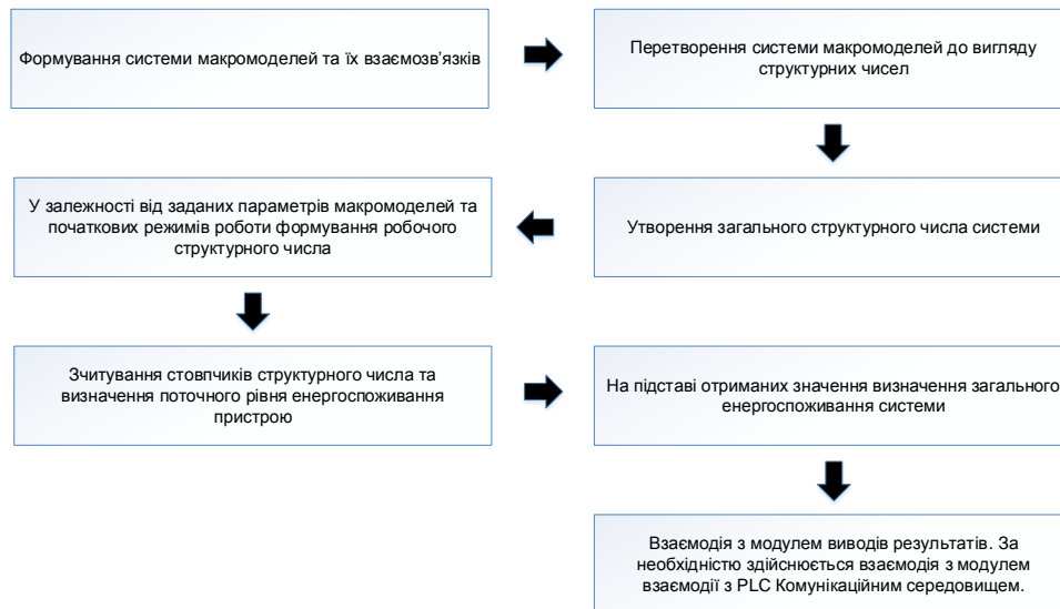
Рис. 3. Етапи макромоделювання за допомогою структурних чисел

Керування здійснюється за допомогою операції похідної та зворотної похідної структурного числа, що відповідають структурним перетворенням системи.