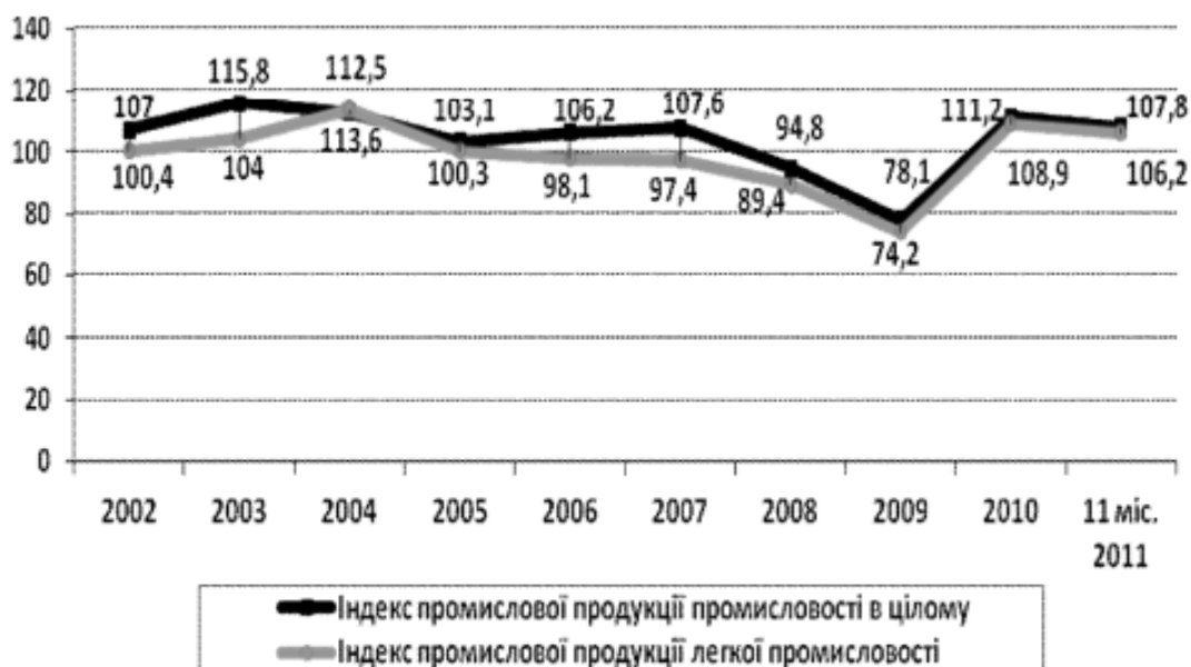
Рис. 1. Динаміка індексів промислової продукції за 2002-2011 рр. (складено за даними [2])

Як свідчать статистичні дані, останні роки у легкій промисловості, як і в інших галузях економіки України, спостерігаються, хоч і незначні, проте позитивні тенденції розвитку, зокрема, нарощування обсягів виробництва продукції, поступове надолуження показників періоду спаду, зумовленого кризовими явищами в економіці та поглибленням системних проблем у самій галузі (рис. 1.).