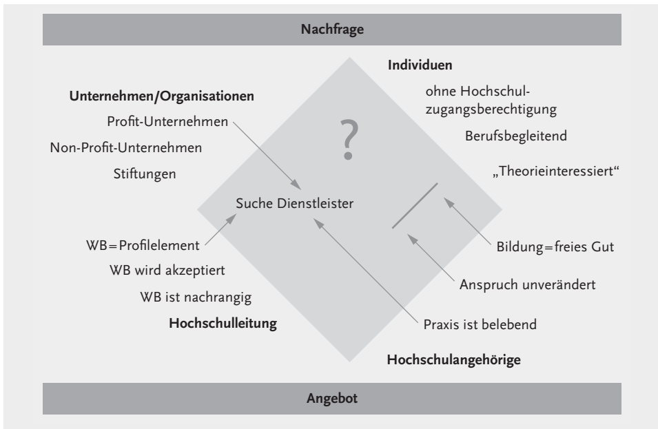
Abb. 1: Mehrdimensionales Beziehungsgeflecht zwischen den vier Zielgruppen (Seitter/Schemmann/Vossebein 2015, S. 56)

Erwarten beispielsweise gewinnorientierte Unternehmen – stärker als Non-Profit-Einrichtungen oder Stiftungen – eine effiziente, bedarfsgerechte Dienstleistungsorientierung der Hochschulen mit Blick auf Konzeptionierung, Umsetzung und Abwicklung von Studienangeboten, so ist es notwendig, dass nicht nur die Hochschulleitung die wissenschaftliche Weiterbildung als entsprechendes Profilelement definiert, sondern sich auch Hochschulangehörige sowohl auf der Wissenschafts- wie auf der Verwaltungsebene finden, die einer derartigen Erwartungshaltung von Serviceorientierung tatsächlich entsprechen wollen und beispielsweise nicht darauf beharren, Bildung als ein kostenfreies öffentliches Gut zu verstehen. Erst in der erfolgreichen Passung dieser zielgruppenspezifischen Perspektiven entsteht der organisationale Möglichkeitskorridor erfolgreicher wissenschaftlicher Weiterbildung.