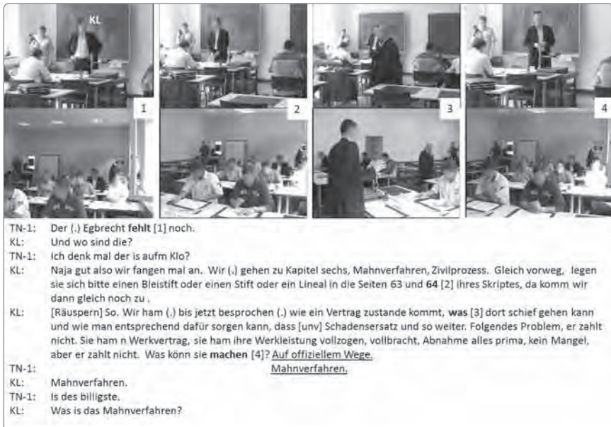
Abbildung 7: Direktives Initiieren des pädagogischen Geschehens

In beiden Fällen ist es nicht ausgeschlossen, dass die Teilnehmenden das Agieren der Kursleiter nicht lediglich als Informationssuche, sondern auch als Kontaktersuchen wahrnehmen und als Anlass nehmen, komplementär Erreichbarkeit zu demonstrieren. Beim Agieren des Rechtskursleiters wird dies als erwartete Anschlussoption an seine explizit geäußerte Frage sogar vorausgesetzt. 9 Beim Agieren des Leiters des Marketingkurses wird den Anwesenden mehr Freiraum gelassen: Die Kursteilnehmenden können seine Äußerung als selbstbezogenes Informieren oder auch als fremd-adressiertes Kontaktersuchen interpretieren. 10