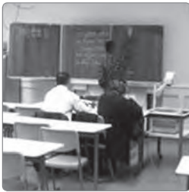
Abbildung 2: Entfernen des Tafelanschriebs

Mit allen diesen Handlungen erzeugen sie die Erwartung, in entfernter Zukunft – an einem bestimmten Ort, in einer bestimmten Rolle und mit einem bestimmten Aufmerksamkeitsfokus – verfügbar für die Beteiligung an einer spezifischen pädagogischen Handlungspraxis zu sein, auf die durch die Spezifität des Raumes wie auch der Gegenstände und durch den handelnden Umgang mit ihnen hingewiesen wird. Zwar wird die künftige Realisierung eines Lehr-/Lerngeschehens auf diese Weise als Erwartung kommuniziert; der Vollzug eines Phasensprungs vom Anfang zum Zentrum wird indes als ein noch etwas entfernt liegendes Ereignis dargestellt.