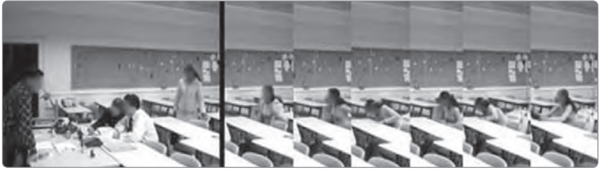
Abbildung 1: Bereitstellen von Gegenständen