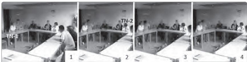
Abbildung 4: Selbstdarstellung als Experte für ein bestimmtes Thema

TN-1: Warst du [1] noch lange da? TN-2: Bitte [2]? TN-1: Warst du noch lange da [3]? Hast du noch fertig geguckt? TN-2: Jaa [4]. TN-1: War ganz gut, ger?