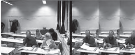
Abbildung 3: Selbstständige Beschäftigung mit dem Vermittlungsthema

Beim Ausweichen geben sich Akteure weder als verfügbar zur Partizipation am pädagogischen Geschehen noch als beschäftigt mit der Herstellung von Voraussetzungen pädagogischer Disponibilität zu erkennen. Sie beschäftigen sich bspw. selbstständig mit dem künftigen Vermittlungsthema (vgl. Abb. 3), stellen sich als Experte für ein bestimmtes Thema dar (vgl. Abb. 4) oder unterhalten sich mit anderen Anwesenden über Alltagsthemen (vgl. Abb. 5).