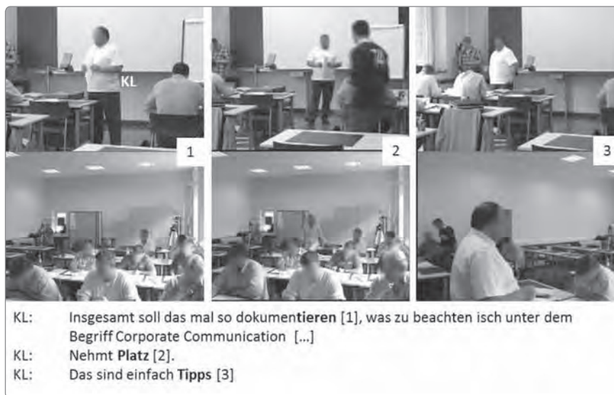
Abbildung 9: Störung des Lehrvortrags

interessen geht hier mit einer Expansion des Etablierungsgeschehens einher. Dies schlägt sich auch in der Situation nieder, in der die verspäteten Teilnehmenden den Raum betreten (vgl. Abb. 9). Anders als im Rechtskurs veranlasst ihr Erscheinen eine Ablenkung der bereits anwesenden Teilnehmenden vom Lehrvortrag des Leiters. Statt darüber hinwegzusehen, unterbricht dieser abermals seinen Aktivitätsstrang, um dann, nachdem die bestehenden Synchronisationsdiskrepanzen bearbeitet wurden und die Teilnehmenden von ihren Plätzen aus Erreichbarkeit signalisiert haben, seinen Vortrag fortzusetzen. Bedeutsam für die Strukturierung des Anfangs der Marketingeinheit ist die Kontextinformation, dass – anders als bei der Rechtseinheit – kein prüfungsrelevantes Wissen vermittelt wird. Daher können Sanktionsgelegenheiten in geringerem Ausmaß als Erwartung vorausgesetzt werden.