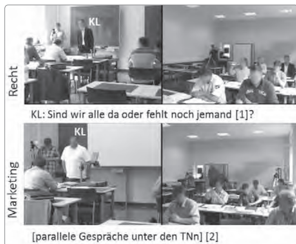
Abbildung 6: Überprüfung der Anwesenheit

Nachdem die Teilnehmenden eines Rechtskurses den Unterrichtsraum wieder betreten und sich auf ihren Plätzen eingefunden haben, verschafft sich der Kursleiter einen Überblick über den Verfügbarkeitsstatus der Teilnehmenden. Er prüft, ob alle wieder anwesend sind. Statt die aktuelle Situation visuell zu „scannen“ und mit der Teilnahmeliste abzugleichen, fragt er in die Runde, ob noch jemand fehlt und wo die Person sich befindet (vgl. Abb. 6 oben). Eine vergleichbare Situation ereignet sich in einem Marketingkurs. Nachdem die meisten Teilnehmenden nach der Pause bereits wieder an ihren Plätzen sind, verschafft sich auch der Veranstaltungsleiter Informationen über den Verfügbarkeitszustand der (erwarteten) Teilnehmenden. Im Unterschied zu seinem Kollegen inspiziert er die Situation allerdings visuell (vgl. Abb. 6 unten).