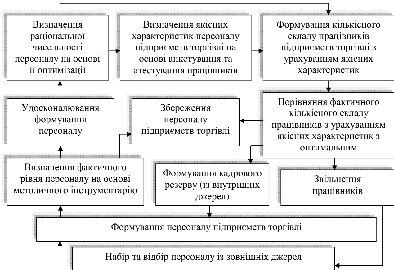
Рис. 2. Формалізована схема механізму формування персоналу підприємств торгівлі Кіровоградської області

Враховуючи зазначене вище, розроблено схему механізму формування персоналу для підприємств торгівлі Кіровоградської області (рис. 2), який передбачає оптимізацію чисельності працівників відповідно до торговельного процесу.