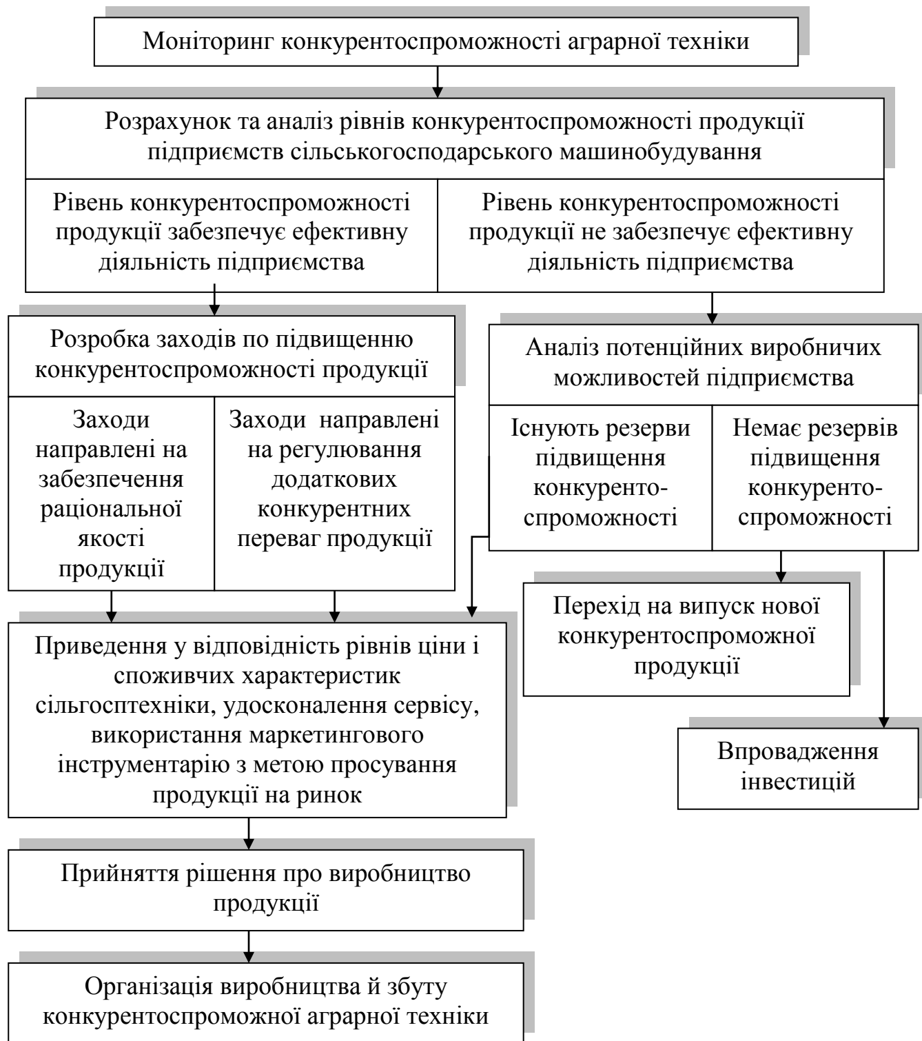
Рис. 2. Системний підхід до регулювання конкурентоспроможності продукції підприємств сільськогосподарського машинобудування

Основні стратегії розвитку, запропоновані автором, направлені на удосконалення та підтримку конкурентних переваг сільськогосподарської техніки в залежності від вимог кожного сегменту ринку. Серед них: стратегія «ціна - якість», яка має на меті приведення у відповідність якісного рівня і ціни