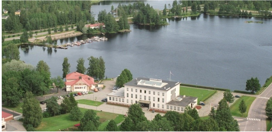
Kuva 1. Gustaf-museo ja Koskelanlampi. Serlachius (n.d.).

Viestikilpailussa on sekajoukkueet, joissa on vähintään kaksi tyttöä, yhteensä kussakin joukkueessa on kuusi juoksijaa. Viestiosuuksien pituudet ovat 150–300 metriä. Kilpaviestin sarjajako on: 3.–4.luokat, 5.–6. luokat, 7.–9. luokat ja opiskelijat.