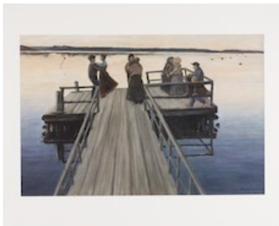
Kuva 3. Hugo Simbergin Laituritanssit. (Serlachius n.d.h).

Taidesarjan aiheena vuonna 2016 oli tehdä valokuvauksen keinoin moderni versio Hugo Simbergin taulusta Laituritanssit (Kuva 3). Taidesarjan tehtävä oli luonteeltaan sellainen, että se voitiin toteuttaa suhteellisen nopeassa tahdissa ja aivan aikataulun mukaisesti.