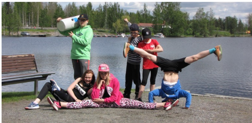
Kuva 4. Taidesarjan voittajakuva (Serlachius n.d.).

Ryhmät pääsivät yllättävän nopeasti ideoinnin alkuun ja neuvoteltuaan keskenään asettuivat kuvattaviksi (Kuva 4). Taidesarjan kuvaukset toteutettiin nopeassa tahdissa, kuitenkin kiireettömästi ja ryhmäläiselle jätettiin aikaa ideoida oma moderni tulkintansa Simbergin taideteoksesta.