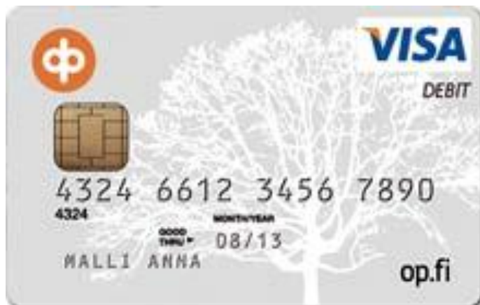
Kuvio 4: Visa-kortti

ei sillä hetkellä ole. (Weatherford 1997, s.226) Luottokortilla voi olla myös luottoraja, joka määrittää miten paljon kortin haltija voi ostaa luotolla, ennen kuin kortti ei enää toimi (Österback 2012, s.16)