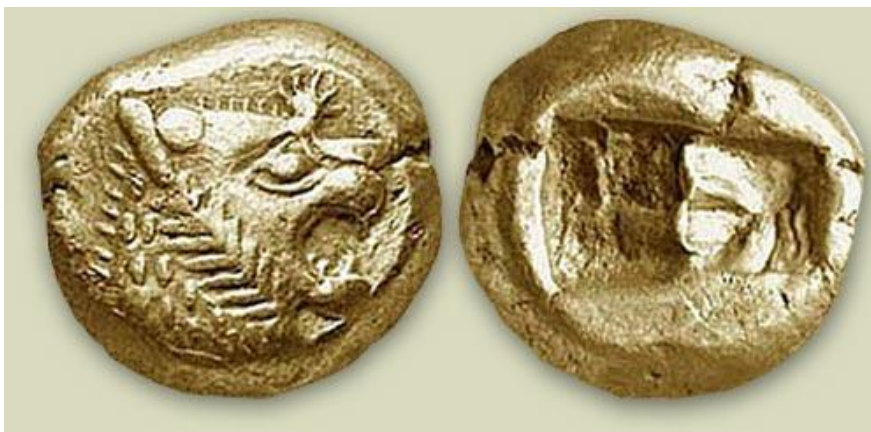
Kuvio 2: Maailman ensimmäinen kolikko

Kolikoiden keksimisen seurauksena tuli toinen kehittyi toinenkin kaupankäyntiin vaikuttanut idea: vähittäiskauppa. Aiemmin kaupankäynti oli ollut vaihtokauppaa. Ei voitu puhua varsinaisesta ostajasta ja myyjästä, koska kumpikin kauppasi jotain, mitä heillä oli johonkin mitä he tarvitsivat tai halusivat. Kolikoiden myötä kehittyi ensimmäiset varsinaiset marketit, joissa ihmiset myivät tavaroitaan rahaa vastaan. (Weatherford 1997, s. 31)