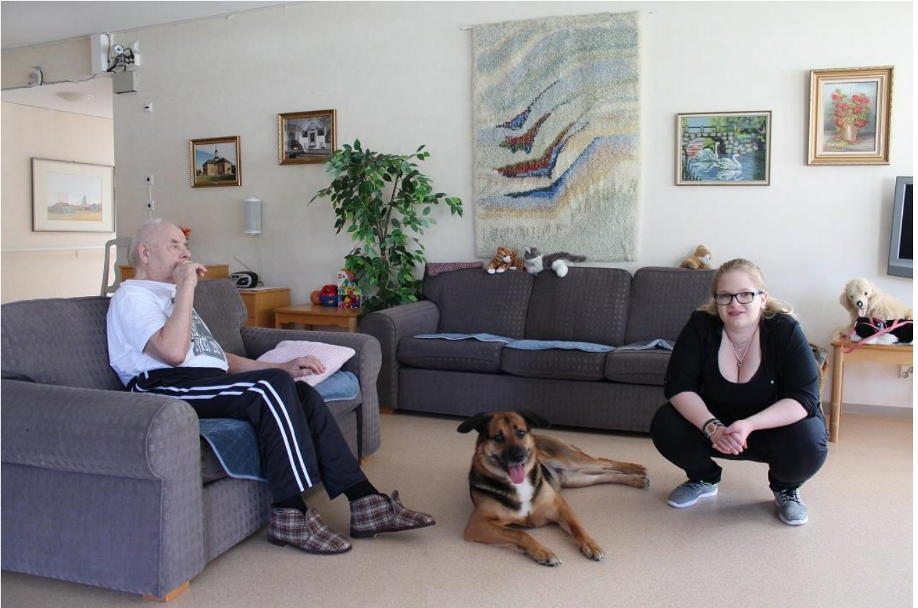
KUVA 6. Tutustumista muistisairaiden osastolla

Tutkimuksissa on todettu, että palvelukodeissa asuvat vanhukset tykkäävät silittelä ja jutella eläinten kanssa. Toisinaan vanhus saattaa jopa lähteä liikkeelle ja aktivoitua entisestään piristyessään eläimen seurasta. Tämä myös aktivoi vanhuksia kanssakäymiseen toisten ihmisten kanssa, ja näin ollen mahdollistaa erilaisiin viriketuokioihin osallistumisen ja niistä nauttimisen ja hyötymisen. Lemmikkieläimen läsnäolo rauhoittaa muistisairasta ihmistä ja tätä havaintoa onkin pyritty hyödyntämään useissa eri laitoksissa ympäri maailmaan. (Vartiovaara 2006.)