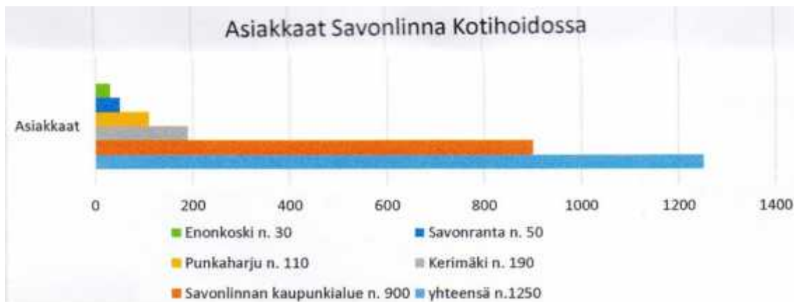
Kuva 1. Kotihoito palvelujen tuottajana. Sosterin kotihoito (Laurio 2017)

Kotihoidon palveluihin kuuluu hoito- ja hoivapalvelut, sairaan- ja terveydenhoitopalvelut sekä tukipalvelut. Kotihoidon tukipalveluita ovat ateria-, kauppa-, turvakylvetys ja pyykkipalvelut sekä lisäksi hoitotarvikejakelu. Sotaveteraanien ja sotainvalidien hoito-, hoiva- ja siivouspalveluja tukee valtionkonttori. Nämä palvelut tuotetaan kotihoidon ja yksityisten palveluntuottajien avulla. (Laurio 2017).