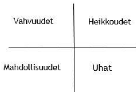
Kuvio 1: SWOT - analyysin nelikenttä

SWOT - analyysi on yksi tunnetuimmista kehittämistyökaluista ja sen käyttämistä ryhmätöiden tarkastelussa puolsi analyysin helppokäyttöisyys ja muunneltavuus. (Virtanen 2007, 189). Tässä opinnäytetyössä SWOT - analyysia käytetään apuna tarkastellessa ryhmän vahvuuksia ja heikkouksia sekä tulevaisuuden mahdollisuuksia ja uhkia. SWOT - analyysin avulla tehdyn tarkastelun tarkoitus oli työelämän kehittäminen. SWOT - analyysia on aikaisemminkin käytetty rikosseuraamusalan kehittämisessä. Esimerkiksi Tourunen ja Perälä (2004) ovat käyttäneet nelikenttämenetelmää Helsingin vankilan päihitteettömän osaston arviointi- ja kehittämistutkimuksessa.