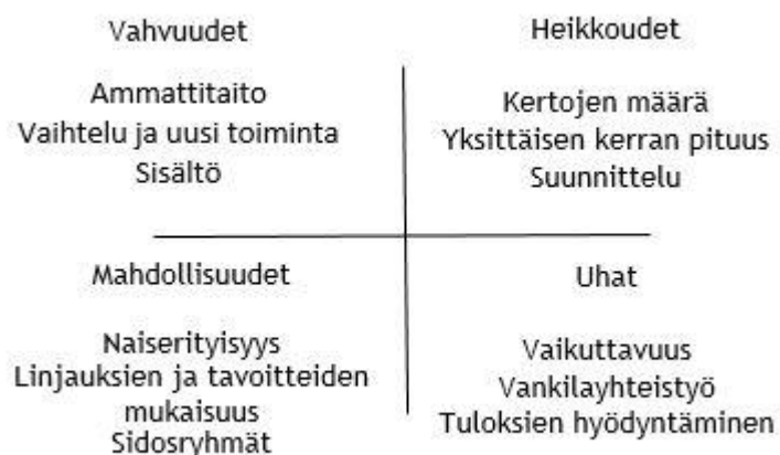
Kuvio 2: Nelikenttäanalyysi ryhmätoiminnasta

Yllä olevassa kuviossa on kuvattu nelikenttäanalyysillä tehty tarkastelu toteutuneesta ryhmätoiminnasta. Tehdyn analyysin perusteella ryhmän vahvuuksia olivat ohjaajien ammattitaito, ryhmän tuottama uudenlainen toiminta ja sen tarjoama vaihtelu naisille sekä sisältö, jossa oli pystytty huomioimaan nais erityisyys. Heikkouksia olivat ryhmäkertojen liian vähäinen määrä ja yksittäisen kerran kesto. Heikkoudet olivat osittain samoja tekijöitä, jotka nousivat esille naistenkin kehitysideoissa. Tämän lisäksi ryhmän suunnitteluun olisi tullut panostaa enemmän.