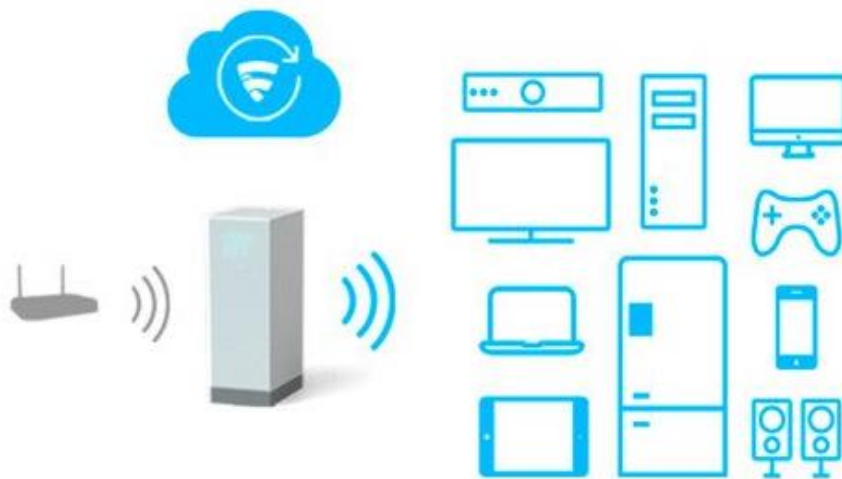
Kuva 3. F-Secure Sense (F-Secure 2016).

Seuraavassa kuvassa näkyy, kuinka Sense sijoittuu kotiverkkoon. Sense-laitteen päällä oleva kuva pilvestä ja F-Securen logosta kuvastaa pilvipalvelussa Secure Cloud -järjestelmällä tehtyä verkon tapahtumien analyysiä.