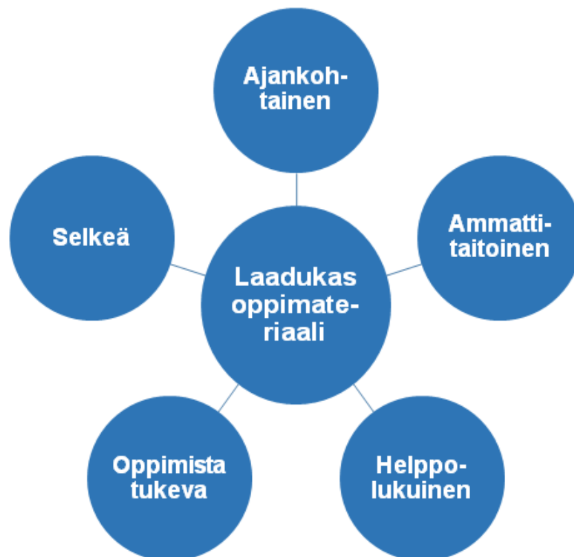
KUVIO 1. Oppimateriaalimme laatukriteerit.

Laatukriteerit kantapäänäytteenottoa koskevaan verkko-oppimateriaaliin on laadittu Opetushallituksen ja Suomen tietokirjailijoiden kriteereiden pohjalta. Laatukriteerit ovat ajankohtainen, helppolukuinen, selkeä, oppimista tukeva ja ammattitaitoisesti tuotettu (katso kuvio 1.). Kriteereiden avulla verkko-oppimateriaalista on pyritty tekemään käyttäjäystävällinen, kohderyhmälle sopiva sekä oppimista edistävä.