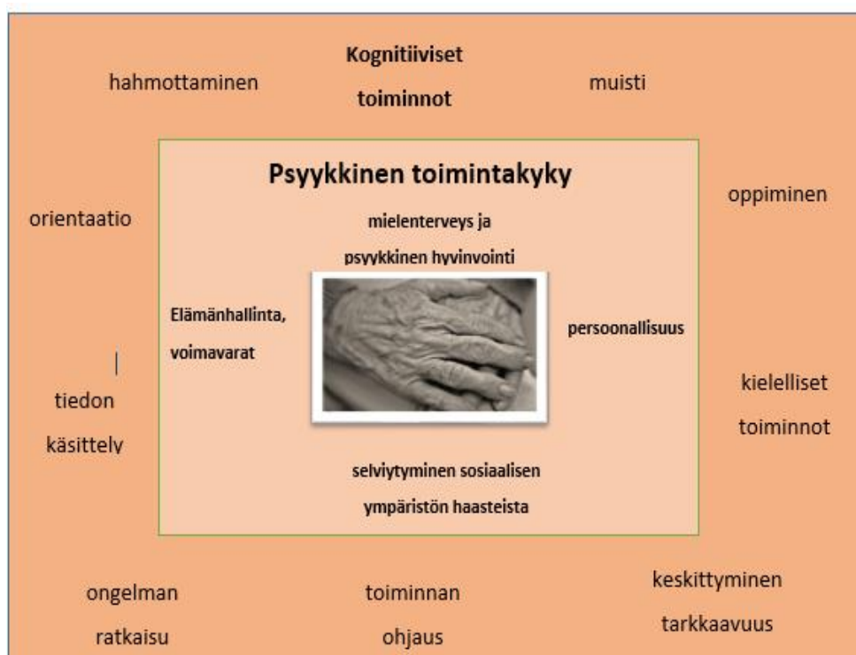
Kuvio 1: Psyykkisen toimintakyvyn osa-alueita.

Psyykkisessä toimintakyvyssä on kysymys ihmisen elämäntilanteesta ja voimavaroista, persoonallisuudesta, mielenterveydestä sekä selviytymisestä sosiaalisissa tilanteissa. Voimavarojen avulla hän kykenee selviytymään arjen haasteista. Psyykkiseen toimintakykyyn kuuluu kyky tuntea, kokea ja muodostaa käsityksiä omasta itsestä ja ympäristöstä, suunnitella asioita ja tehdä ratkaisuja. Psyykkisesti toimintakykyinen tuntee voivansa hyvin, arvostaa itseään, luotta kykyynsä selviytyä arjen tilanteista, suhtautuu realistisen luottavaisesti tulevaisuuteen ja ympäröivään maailmaan, Kognitiiviset, tiedon käsittelyyn ja ajatteluun liittyvät toiminnot, kuten muisti, oppiminen, kielelliset toiminnot, keskittyminen, toiminnan ohjaus, ongelmien ratkaisu, tiedon käsittely, orientaatio ja hahmottaminen ovat keskeisiä psyykkisiä toimintoja, joita käsitellään usein itsenäisenä toimintakyvyn osa-alueena. (Toimintakyvyn ulottuvuudet 2015.) Psyykkisen toimintakyvyn osa-alueita on esitelty kuviossa 1.