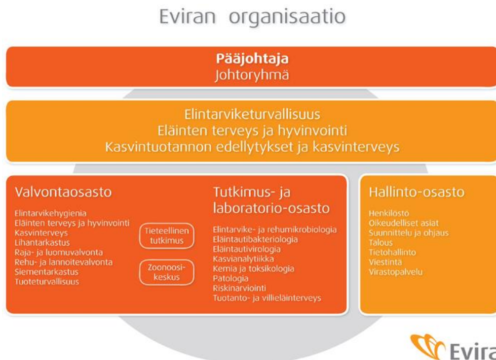
Kuva 2. Eviran organisaatio (Evira, Tietoa Evirasta, 2017).

Evira on lupa- ja valvontavirasto, joka toimii Maa- ja metsätalousministeriön alaisena. Virasto on perustettu maa- ja metsätalouden tuotantotarvikkeiden sekä elintarvikkeiden turvallisuuden ja laadun, eläinten terveyden ja hyvinvoinnin sekä kasvinterveyden tutkimusta ja valvontaa varten (laki elintarviketurvallisuusvirastosta 25/2006). Tehtävänä virastolla on toimialansa toimeenpanotehtävien johtaminen, ohjaaminen ja kehittäminen, valvonta ja riskinhallinta, riskinarviointi ja tieteellinen tutkimus sekä muut selvitykset ja tutkimukset. Lisäksi Eviran vastuulla on toimialansa viestintä, kouluttaminen, neuvonta ja kansainvälinen yhteistyö sekä toimia vertailulaboratoriona. Toiminta-ajatuksena virastolla onkin edistää turvallisuutta, luotettavuutta ja laatua elintarvikeketjussa. Kuva 2 havainnollistaa Eviran organisaatorakennetta.