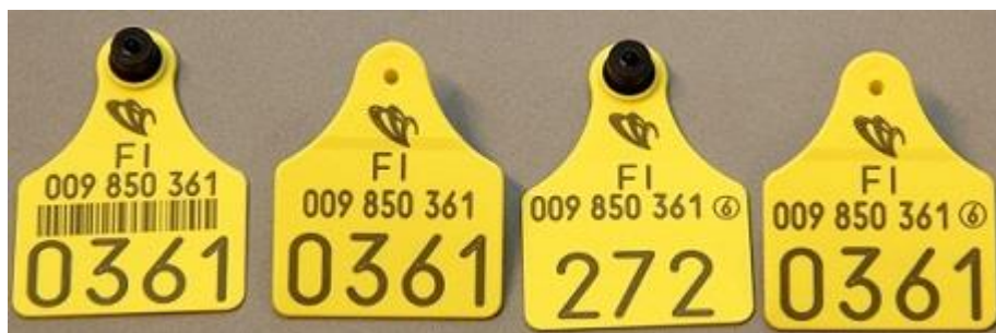
Kuva 4. Allflex Ultra Senior pää- ja apumerkki, on yksi Suomessa käytettävistä nautaeläinten korvamerkeistä [Viitattu 2017-1-28]. (Evira, Merkintä ja rekisteröinti 2017)

Ensimmäisenä valvonnassa tarkastetaan tilan rekisteröityminen. Paikan päällä tilalla tarkastetaan kaikkien eläinten merkitseminen, korvamerkit (kuva 4), sekä eläinten rekisteritietojen ja pitopaikkojen ajantasaisuus eläinluettelosta. Valvonnassa tarkastetaan myös tilan kaikkien rekisteriin tehtyjen eläinten tapahtumien ilmoitusaikojen noudattaminen viimeisen kalenterivuoden alusta saakka. Vuodesta 2013 alkaen on ilmoitusaikojen noudattamatta jättäminen ollut myös osa täydentävien ehtojen seuraamusten arviointia. [Viitattu 2017-1-28]. (Evira, Merkintä ja rekisteröinti 2017)