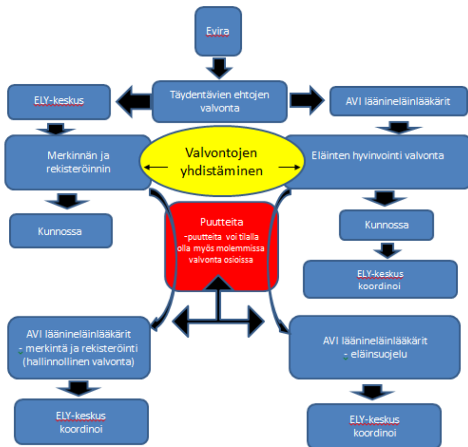
Kuva 5. ELY-keskuksien ja AVI:n läänineläinlääkäreiden tekemät eläinvalvonnat tilalla. (Nuutinen, 2017)