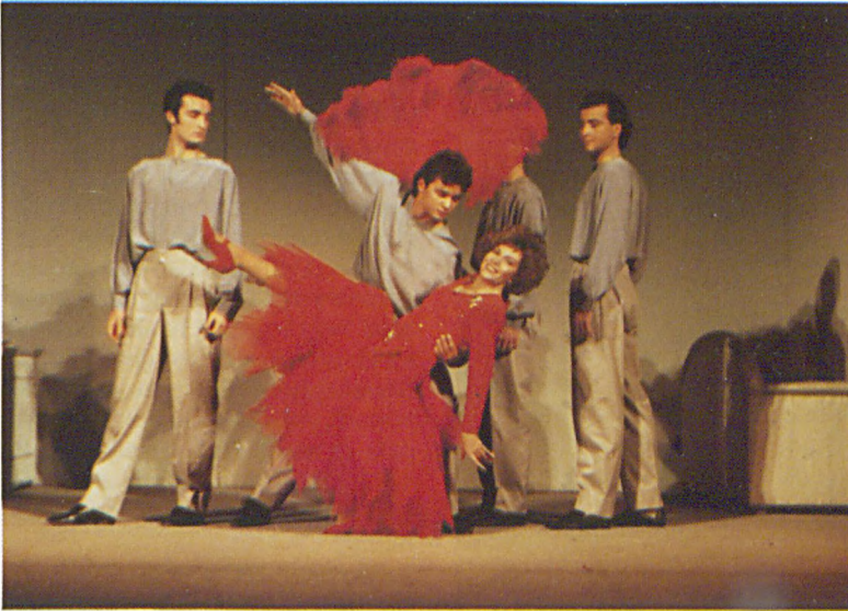
Dormen'in yönettiği son oyun "Yolun Yansı"ndan bir sahne

Oturma odası modern bir Dionysos tapınağı görünümünde, hayallerin ve gücün birleşip hayalgücüne dönüştüğü bir yer