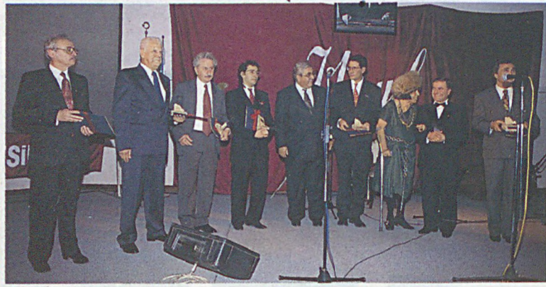
Ödül alan konuklar..