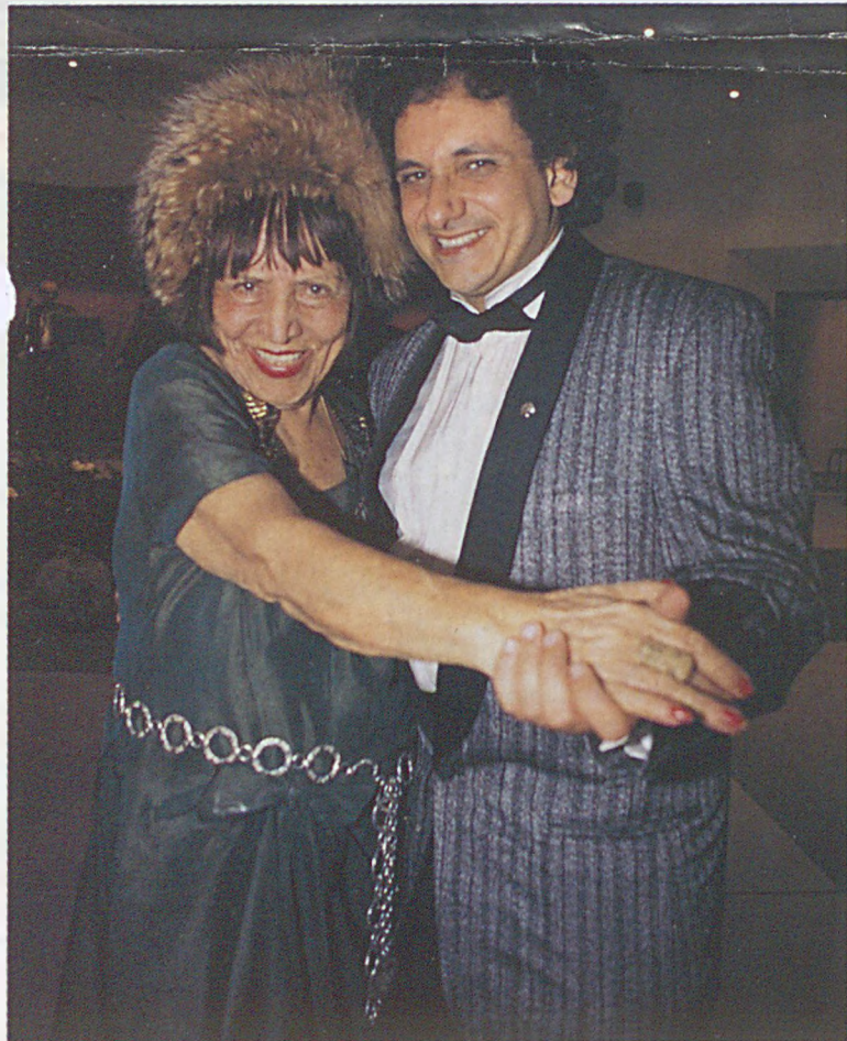
Semiha Berksoy, Bedri Baykam