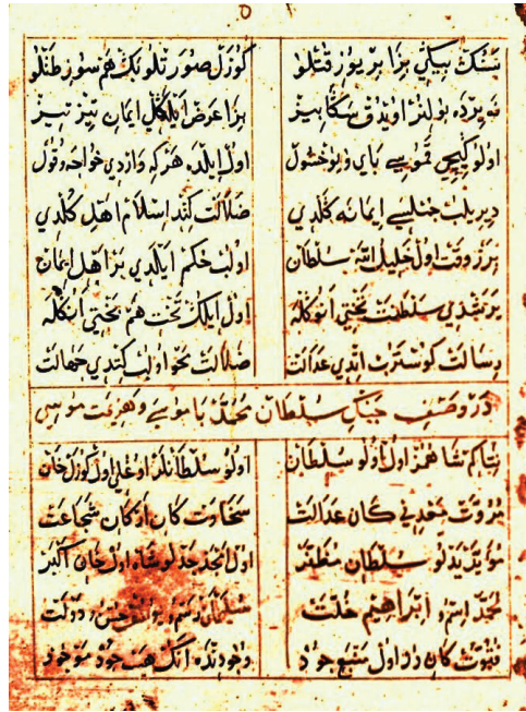
Şekil 1: Fetret devri ve Çelebi Sultan Mehmed dönemi şâirlerinden Abdülvâsi' Çelebi'nin, Halil-nâme 'sinde 816/1414 Çamurluova Savaşını tasvir eden "Ceng-i Sultân Muhammed bâ-Mûsâ ve Hezîmet-i Mûsâ" adlı manzûmesine giriş yaptığı kısım (Kahire Dârü'l-Kütübî'l-Kavmiyye, Edeb. Türki: M/82, vr. 59 a ).

cereyân eden Çamurluova Savaşını nazmettiği "Ceng-i Sultân Muhammed bâ-Mûsâ ve Hezîmet-i Mûsâ" başlıklı kısımdır 7 . Daha önce kaleme aldığı İs-kender-nâme 'sine, "Dâsitân ve Tevârih-i Mülûk-i Âl-i 'Osmân" adıyla Emîr Süleymân'a kadar uzanan bir Osmanlı tarihi metni ekleyen Ahmedî'ye mülhak olarak "Ceng-nâme"yi yazdığını manzûmenin içinde açıkça dile getiren müellif 8 ; savaş sırasında olup bitenleri bir görgü şahidi olarak bir yıl sonra (817/1415), savaşın izleri henüz hâtıralarda canlılığını korurken ustaca nazmetmiştir.