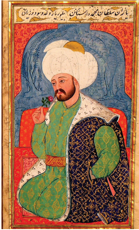
Şekil 2: Seyyid Lokman'ın fırçasından Çelebi Sultan Mehmed ( Kıyâfetü'l-İnsâniyye fî Şemâ'ili'l-Osmâniyye , Ali Emîri, Tarih, nr.: 1216, vr. 32 b ).

Onun burada, fetretten savaşa kadar uzanan süreci özetleyen beyitleri; Mûsâ Çelebi'nin Rumeli'ye geçtikten sonra niyetinin değişmesi, savaş öncesi yapılan hazırlıklar ve iki tarafın karşılıklı sözleri, sınır devletlerin sefer öncesi ve sefer sonrasındaki faaliyetleri; savaş ânında yaşananlara, pâdişâhın ve vezirlerinin savaş sırasındaki atılganlıklarına, savaştan sonra Mûsâ Çelebi'nin esir alınıp “nizâm-ı ‘âlem için” ortadan kaldırılmasına ve hazinelerin ve eşyaların kâtipler tarafından defterlere zaptına ilişkin tasvirleri ve dönemin savaş âletlerinin isimlerini ayrıntılı olarak zikretmesi, târih araştırmacılarına dönemin siyâsî ve askerî tarihini aydınlatmaya yarayacak oldukça orijinal ve nitelikli bilgiler vermektedir.