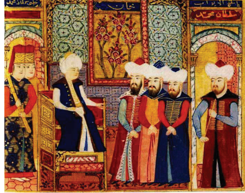
Şekil 5: Çamurluova Savaşı'nda kardeşi Mûsâ Çelebi'yi hezimetete uğratan Çelebi Mehmed'i devlet erkânı ile bir arada tasvir eden bir minyatür (İÜ Ktp. TY, nr.: 5970, vr. 264 a ).

Abdülvâsî Çelebi'nin Bursa'dan sonra Osmanlı Devleti'nin ikinci başkenti konumuna yükselen Edirne'de, dönemin önemli din ve devlet adamlarının vakıf ve mülk arâzileri arasında yer alan vakfının, Osmanlı hânedânı ile kadim yakınlığı nazar-ı itibâra alındığında ona Yıldırım Bâyezîd ya da şehrin fâtihi Murad Hüdâvendigâr tarafından, Fetret devrinde daha önceki bir tarihte verilmiş olma ihtimâli oldukça fazladır.