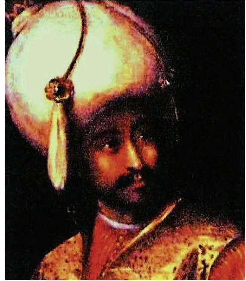
Şekil 3: Mûsâ Çelebi'nin bir portresi (Bayerische Staatgemäl Desammlungen Alte Pinakothek, nr.: 2238, München)

Onun burada, fetretten savaşa kadar uzanan süreci özetleyen beyitleri; Mûsâ Çelebi'nin Rumeli'ye geçtikten sonra niyetinin değişmesi, savaş öncesi yapılan hazırlıklar ve iki tarafın karşılıklı sözleri, sınır devletlerin sefer öncesi ve sefer sonrasındaki faaliyetleri; savaş ânında yaşananlara, pâdişâhın ve vezirlerinin savaş sırasındaki atılganlıklarına, savaştan sonra Mûsâ Çelebi'nin esir alınıp “nizâm-ı ‘âlem için” ortadan kaldırılmasına ve hazinelerin ve eşyaların kâtipler tarafından defterlere zaptına ilişkin tasvirleri ve dönemin savaş âletlerinin isimlerini ayrıntılı olarak zikretmesi, târih araştırmacılarına dönemin siyâsî ve askerî tarihini aydınlatmaya yarayacak oldukça orijinal ve nitelikli bilgiler vermektedir.