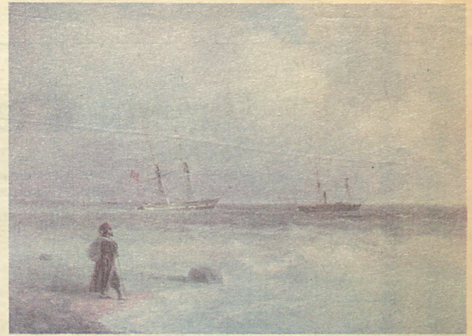
Ünlü şair Puşkin ve devrimci Rus aydınlarıyla dostluk kurduğu dönemlerde Ayvazovski'nin Feodosia'da gerçekleştirdiği “Deniz Kıyısı” (1840) adlı tablosu.

İstanbul'a ilk gelişleri Sultan Abdülmecid'in saltanat devrine rastlayan Ayvazovski, birçok Osmanlı aydın ve sanatçı ile dostluk kurmuştu. Bunlar arasında zamanın Hariciye Nazırı Keçecizade Fuad Paşa da bulunuyordu. Ayvazovski, güzel anılarla ülkesine döndükten sonra Fuad