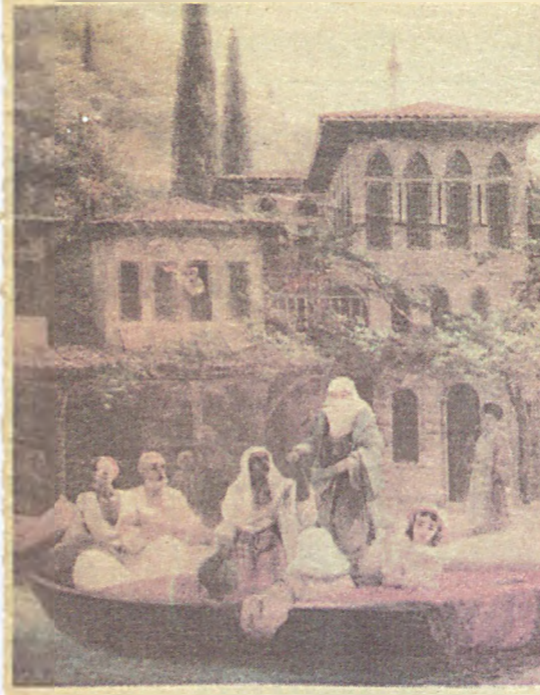
“Doğu'dan Sahneler (Kayıkta)”; yıl 1846

Aleksandr Puşkin, Anton Çehov, Kirilov, Belinski, Jukovski gibi Rus devrimci edip ve aydınlarının; Rus Çar I. Nikola'nın, Fransız İmparatoru III. Napoléon'un, Papa XVI. Gregorius'un, Osmanlı hükümdarlarından Sultan Abdülmecid, Sultan Abdülaziz ve II. Abdülhamid'in