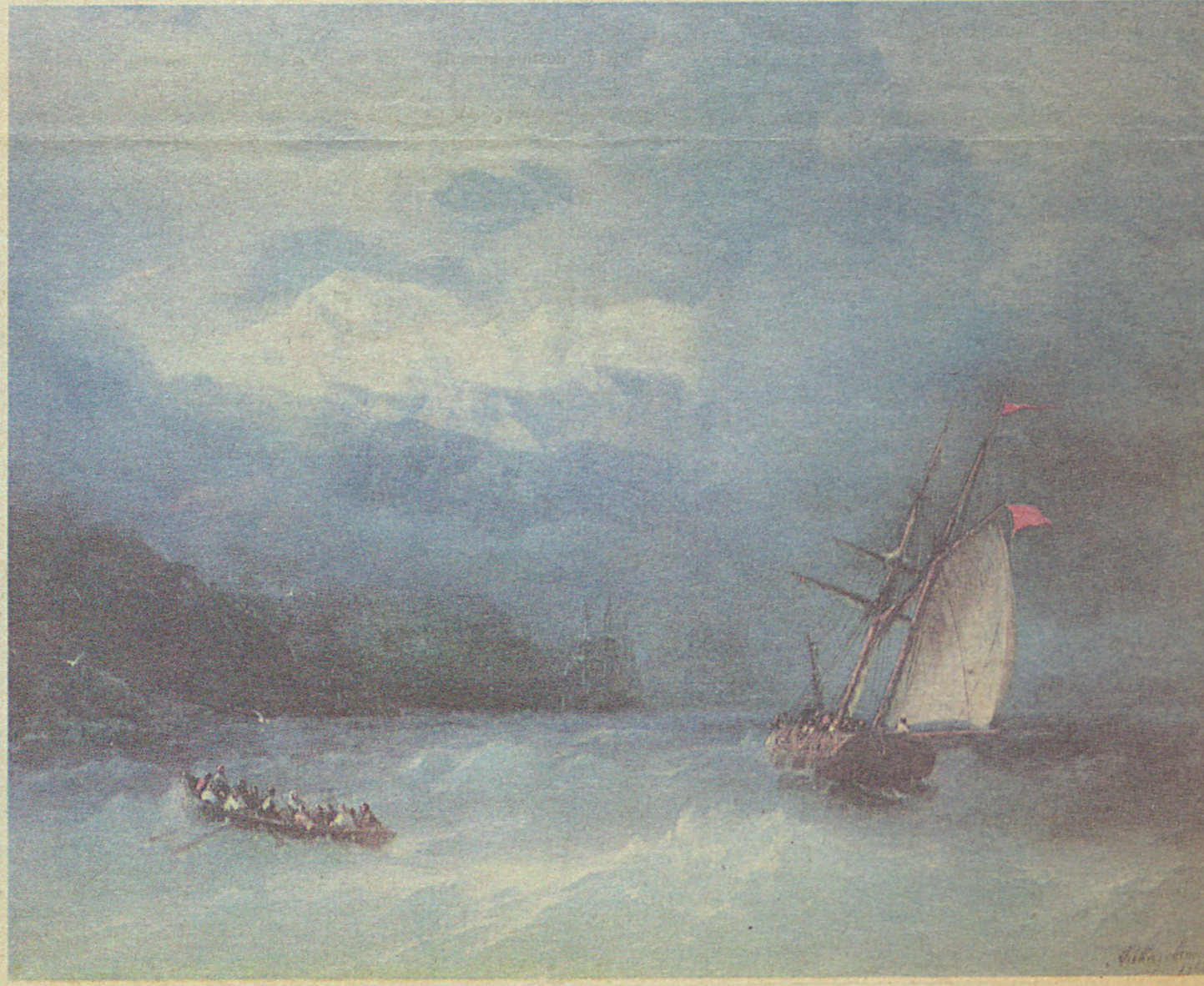
Ayvazovski'nin 1868 yılında, Kafkasya yolculuğuna çıkmadan kısa bir süre önce tamamladığı “Denizde Fırtına” adlı yapıtı.

Sanatçının Türkiye ve İstanbul'a ilişkin eserleri geçmişten günümüze uzanan değerli bir kültür mirasıdır. □