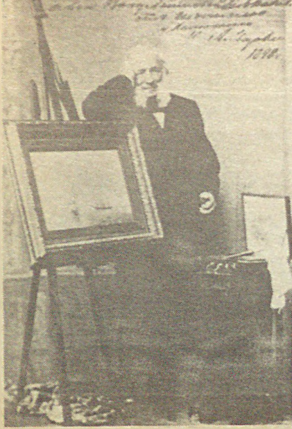
Ivan Konstantinoviç Ayvazovski'nin 1898'de, ölümünden iki yıl önce çekilmiş bir fotoğrafı.