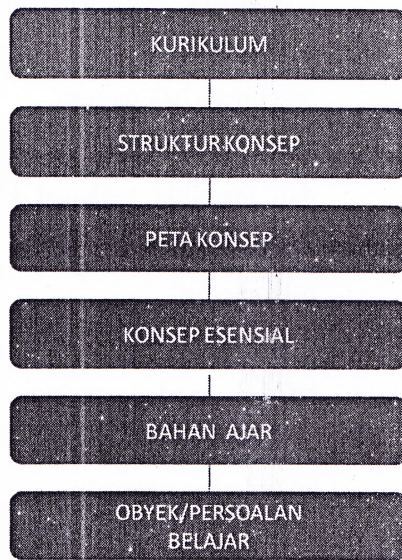
Gambar 2. Kajian Kurikulum – Obyek Persoalan Belajar

Konsep ketiga terkait dengan implementasi kurikulum visioner adalah (3) pembelajaran yang PAKEM. 8 Slogam pendidikan nasional Indonesia “Tut Wuri Handayani” dengan pengejawantahan sistem among yakni mengikuti kemampuan anak dengan keragaman dan perbedaan masing-masing dapat diwujudkan dalam proses pembelajaran yang mengimplementasikan kurikulum yang visioner. Selanjutnya konsep keempat adalah model evaluasi pada kurikulum visioner adalah (4) evaluasi autentik dengan catatan portofolio untuk merekam kinerja siswa dan hasil dapat dijadikan data untuk menentukan arah kecenderungan kemampuan siswa dan potensinya. Ini dapat diimplementasikan untuk pendidikan menengah ke bawah. Sedangkan untuk pendidikan di tingkat perguruan tinggi, evaluasi autentik dapat digunakan sebagai alat untuk memfasilitasi mahasiswa. Hasil evaluasi dijadikan sebagai data masukan bagi dosen untuk memberikan fasilitasi sesuai dengan kecepatan belajarnya.