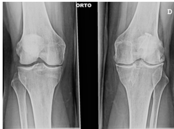
Figura 2. Imagen comparativa de ambas rodillas de un mismo paciente. La rodilla derecha fue intervenida para reconstrucción del LCA y en ella se aprecia un desarrollo precoz de artrosis con respecto a la contralateral (izquierda).

taron dolor anterior de rodilla y tendinitis rotuliana, un paciente presentó artrofibrosis con pérdida de 60° de movilidad que no mejoró con tratamiento rehabilitador y un paciente (4%) se encuentra en lista de espera quirúrgica para artroplastia total de rodilla (ATR) (Fig.2).