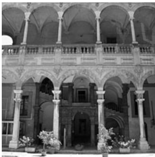
Fig. 4. Palermo. Collegio Massimo dei Gesuiti, cortile, particolare della corsia orientale con la scala.

Nella loggia di sopra [...] sono le scuole destinate alle facoltà scientifiche. In questo stesso ordine superiore chiama la curiosità, e l’attenzione di chichisia la