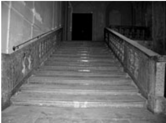
Fig. 7. Palermo. Casa Professa dei Crociferi, scala.