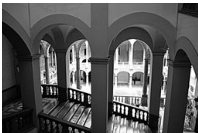
Fig. 8. Palermo. Palazzo Reale, scala.

Precoce appare l'applicazione del marmo rosso siciliano estratto dalle cave di Castellammare (in provincia di Trapani), a quanto sembra lavorato da scarpellini di Alcamo 43 (e non lo screziato Libeccio, che Mongitore chiama pietra di belice ), per rivestire i gradini della scala e per realizzare i passamano e la serrata teoria delle balaustre. La soluzione sarebbe stata successivamente seguita nello scalone del monastero dei Benedettini Bianchi di Monte Oliveto, presso la chiesa di San Giorgio in Kemonia (Nicolò Palma, dal 1747) e nella nuova "scala reale" del convento annesso alla basilica di San Francesco (Paolo Corso, dal 1750-1751) 44 ma, nel contesto del nascente fervore costruttivo dovuto alla committenza aristocratica avrebbe trovato proprio nella sfera civile maggiore diffusione, quando, nel 1735, venne rivestito con questo materiale il già citato scalone del palazzo Reale (fig. 8) in occasione dell'arrivo in città di Carlo III di Borbone. 45 La parabola degli scaloni conventuali si riannodava in tal modo a quella dell'architettura civile, rilanciandone al livello della corte tutte le potenzialità espressive, cromatiche e monumentali che sarebbero rientrate in gioco nelle nuove fabbriche aristocratiche.