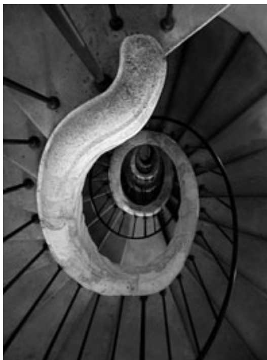
Fig. 6. Palermo. Noviziato dei Crociferi, scala ovale a occhio aperto.

Anche il sacerdote palermitano Antonino Mongitore (1663-1743) commentava il fascino suscitato dalla struttura avvolgente della scala alla vista del pubblico: “Ammirabile è la scala, che porta ai corridoi. Ha essa 111 scalini di pietra d’intaglio, formata a lumaca, e par che stesse fabbricata in aria e da sotto si vede sino alla cima, restando nel mezzo un vano rotondo, uguale da cima a fondo onde per la