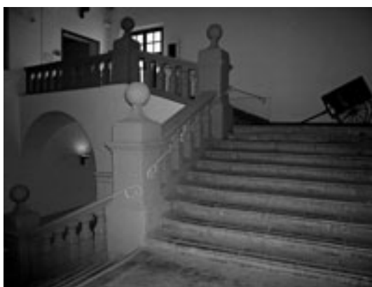
Fig. 1. Palermo. Convento dei Francescani alla Gancia, scala.

Nella città di Trapani si registra infatti un altro caso di scalone monumentale conventuale, innalzato presso il complesso dei Carmelitani (oggi museo Pepoli) (fig. 2). La struttura, a tre rampe e a cassa aperta e con diversi pianerottoli, impreziosita successivamente da stucchi, dalla policromia dei marmi locali (balaustre in Libeccio e pilastri istoriati in pietra Palazzo, passamani con decorazioni a marmi mischi) e dalla loggia superiore cupolata