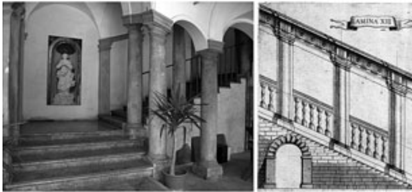
Fig. 5. Palermo. Collegio Massimo dei Gesuiti, scala (a sinistra); Juan Caramuel. Architectura civil recta y obliqua . III vols. Vigevano: en la imprenta obispal por Camillo Corrado, 1678, vol. III, tav. XIII, particolare (a destra).

vesi e venete, quest' ultime progettate da Longhena (scalone di accesso alla biblioteca benedettina di San Giorgio Maggiore a Venezia, dal 1643). 22 La scala possiede un andamento asimmetrico, sebbene la composizione ad arco di trionfo del prospetto che la inquadra suggerirebbe una forma a T con rampe divergenti da una centrale, propria di una scala "imperiale" visibile all'esterno. Pur partendo da una rampa centrale la scala segue infatti una sola direzione ad essa perpendicolare sviluppandosi con rampe contrapposte ma parallele e contigue alla corsia orientale del chiostro che la accoglie nel suo centro.