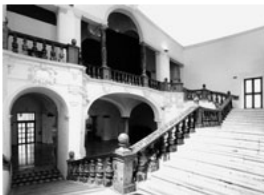
Fig. 2. Trapani. Convento dei Carmelitani, scala.

con serliana, risulta essere stata realizzata a partire dalla fine degli anni Trenta del Seicento ad opera del capomastro-imprenditore Francesco Marchisi (contratto datato aprile 1639). Questo "scalone magnifico" e "architettato alla moderna", così come veniva definito dai cronisti carmelitani, presentava un accesso non assiale, ma pressoché diretto, dal chiostro colonnato in corso di edificazione sempre ad opera del Marchisi (1640-1650). 12 Anche per questo esempio è possibile pertanto confermare l'esistenza di un progetto unitario di ampliamento, razionalizzazione e ammodernamento degli spazi conventuali e dei relativi