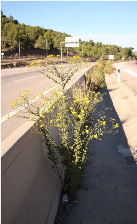
Fig. 1. Heterotheca subaxillaris , en la Poble Tormesa (Castellón).

Heterotheca subaxillaris (Lam.) Britton & Rusby in Trans. New York Acad. Sci. 7(1-2): 10 (1887) = Inula subaxillaris Lam., Encycl. 3: 259 (1789) [basión.] = H. lamarckii Cass. in Dict. Sci. Nat. [F. Cuvier] 21: 131 (1821), nom. illeg.