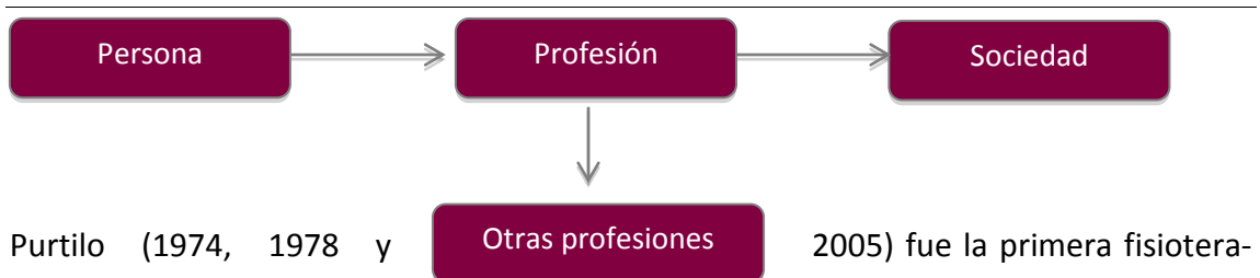
Figura 2. Fuentes de conflicto en las profesiones sanitarias (Thompson, 1976)

Thompson (1976), en sus estudios sobre la ética médica realizados en los años setenta, ya pudo contemplar, en general, tres fuentes de conflicto en las profesiones sanitarias que conviene señalar, dado que se adaptan perfectamente a lo que ocurre en el campo de la Fisioterapia: por un lado, hay conflictos que surgen al confrontarse las convicciones privadas de las personas, con su concepto de lo que requiere su rol profesional. Por otro lado, los hay que surgen cuando las actitudes, valores y objetivos de una profesión confluyen con los de otra distinta, y finalmente, surgen conflictos cuando el ethos (ideología) de una profesión entra en conflicto con el de la sociedad en la que trabaja.