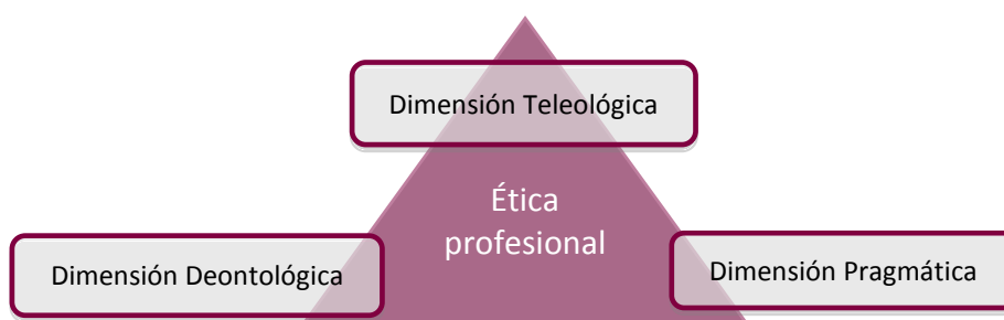
Figura 1. Dimensiones de la ética profesional (Bermejo, 2002)

De las definiciones anteriores se desprende el hecho de que la ética profesional no puede relegarse únicamente al cumplimiento de los códigos deontológicos, como es costumbre observar en la práctica, sino que, como afirma Bermejo (2002), comprende tres dimensiones inseparables que conviene señalar (figura 1).