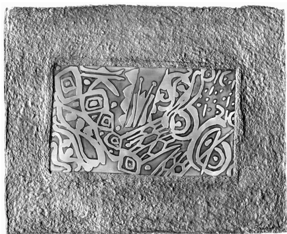
Espíritu del bosque