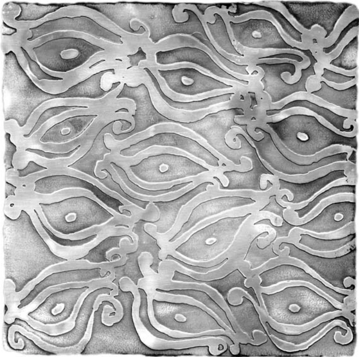
Arena en los pies. Detalle

gico. También dice que la humanidad ha llegado a una situación de peligro precisamente porque tiene la capacidad de poder reorganizar la vida, tanto desde el punto de vista social como del climático y de la naturaleza. Algunos filósofos proponen una ideología muy pesimista diciendo que ya es demasiado tarde; otros, en cambio, dicen que no es el momento todavía de reaccionar, y justamente, el paradigma de estos planteamientos es la reconstrucción permanente de la vida. No sabemos exactamente cómo van a suceder las cosas pero sí tenemos una idea muy firme del paradigma de la reconstrucción de la vida.