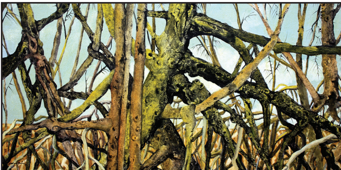
Luces en el manglar. 46 x 92 cm