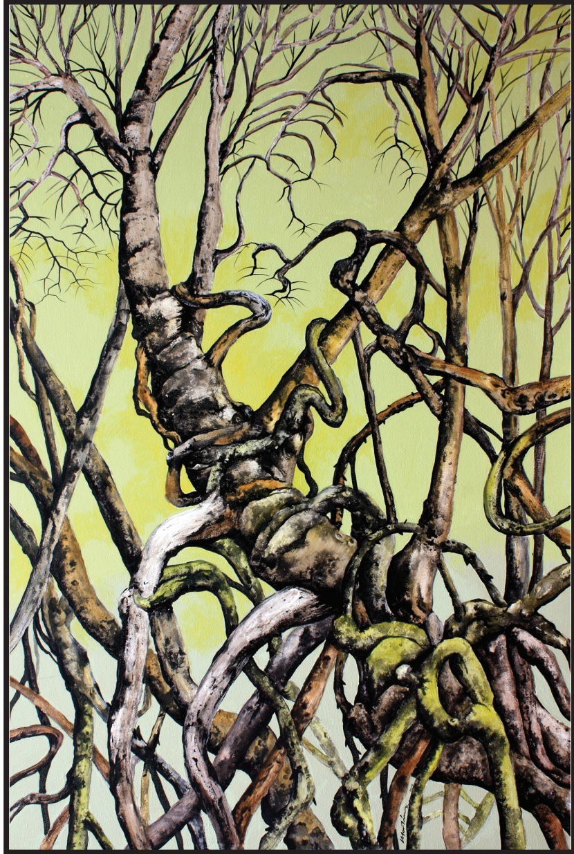
Aire y agua. 183 x 120 cm