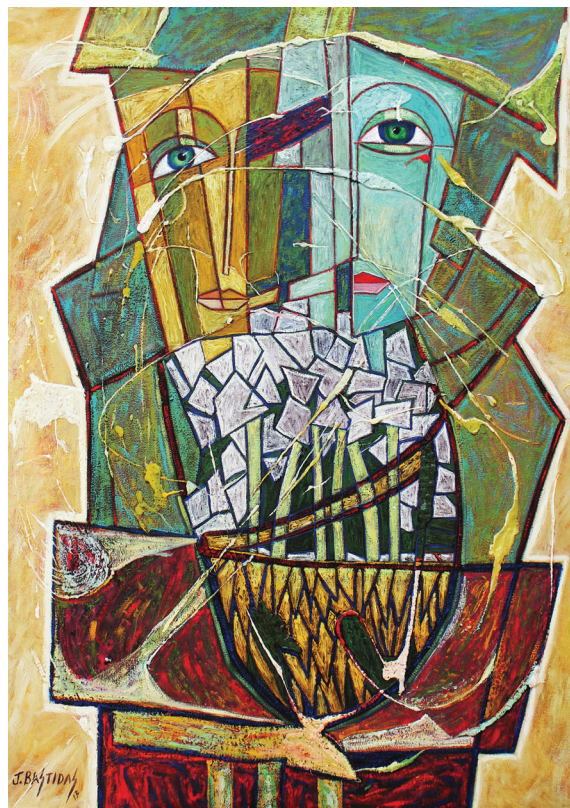
Pareja I 70x90

Lévy (1999) conceptualiza “cibercultura” como un conjunto de técnicas, prácticas, actitudes, modos de pensamiento y valores que