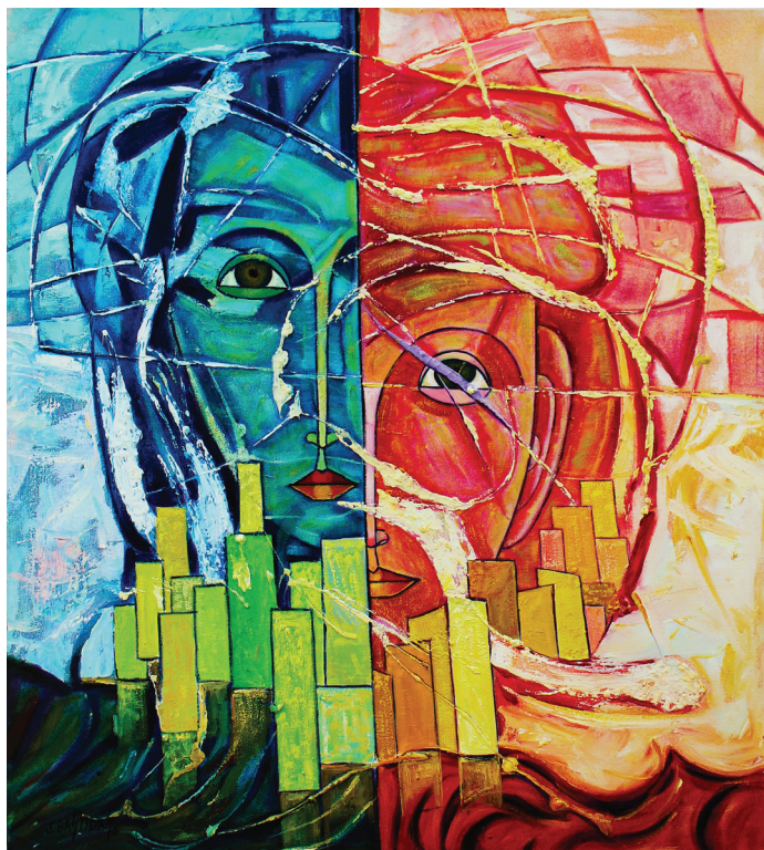
Pareja en una Metrópoli 70x90